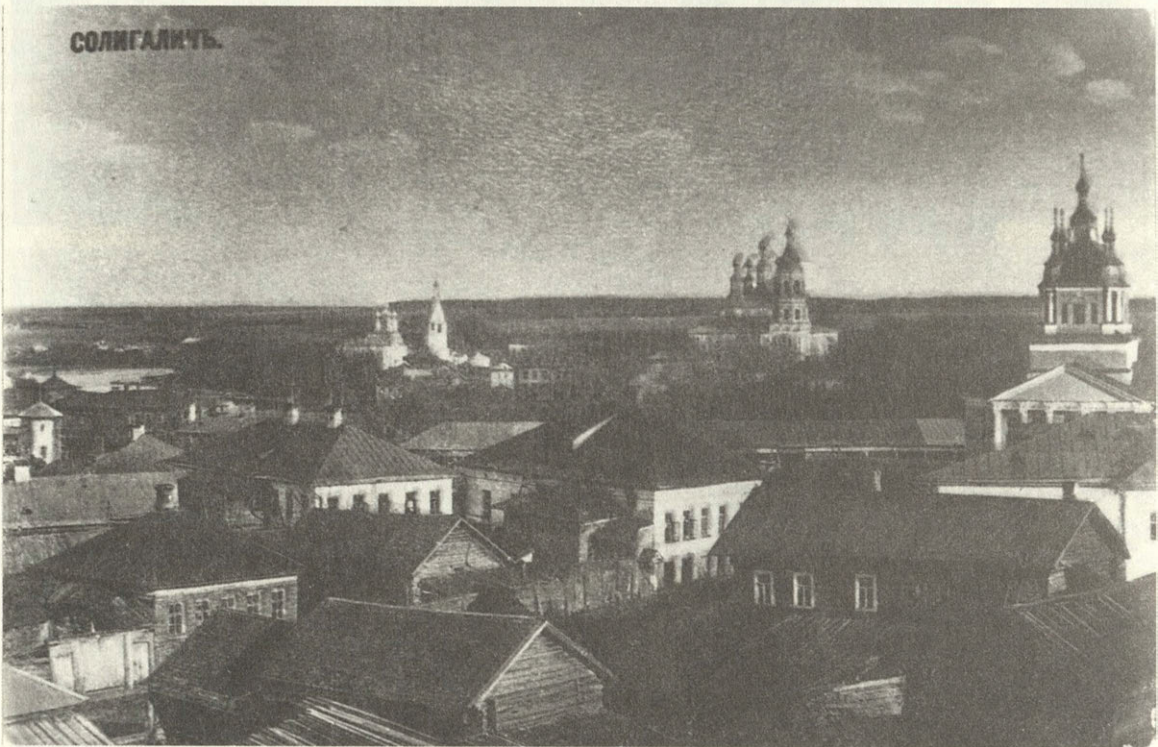
Солигалич. Открытка из коллекции А. Анохина.

Солигалич, расположенный на довольно ровном месте при р. Костроме, берущей свое начало в 30 верстах выше его, находится от губернского города Костромы в 220 верстах.