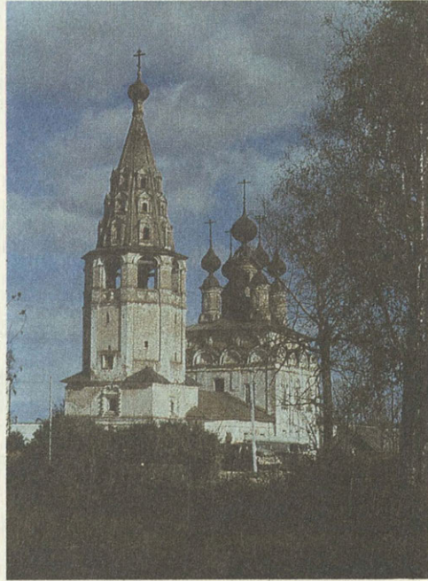
Солигалич. Собор Воскресенского монастыря. 1663—1669.

В княжение Василия Иоанновича Казань старалась ослабить Московское государство. Для защиты от нападения казанских татар Василий Иванович устроил крепости с насыпными земляными валами в Ветлуге, Кологриве, Галиче, Соли-Галичской, Парфентьеве и Чухломе. Опасения были не напрасны: в 1532 году казанские татары напали на Соль-Галичскую в числе 14 тысяч, но, как местная летопись передала, после осады, продолжав-