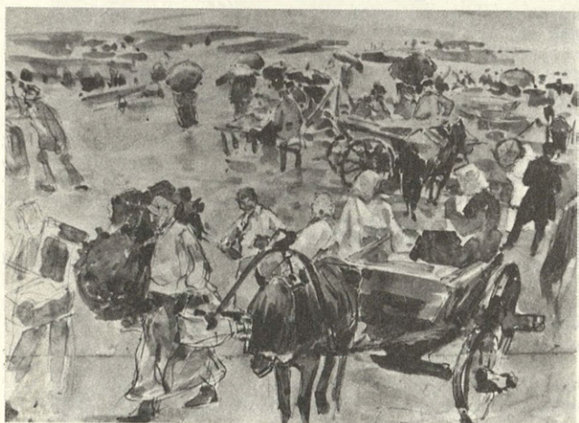
Г. А. Ладыженский. Пейзаж.