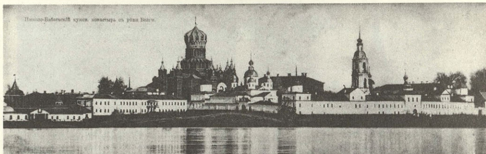
Никола-Бабавский храм, монастырь на реке Волга.