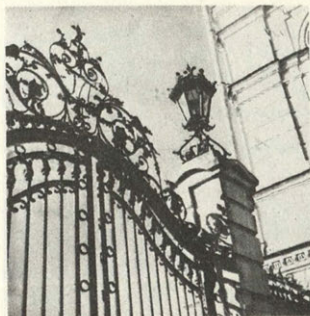
Александровская часовня. Кострома. Не сохранилась. На этом месте установлен новый памятник Ивану Сусанину.