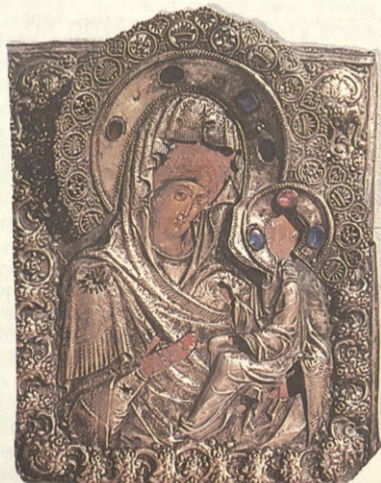
Икона Смоленской Божией Матери. Никольская церковь поселка Сусанино. Пожертвована прихожанами.