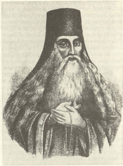
Св. Паисий Величковский

ние монахов, как живая связь учителя с учеником, который впоследствии сам становился наставником. Проведя в абсолютном послушании несколько лет, монах был способен на самостоятельный подвиг.