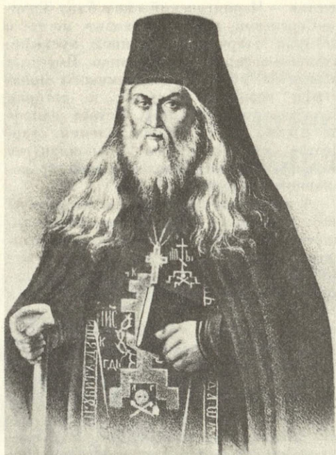
Старец Леонид (в схиме Лев)