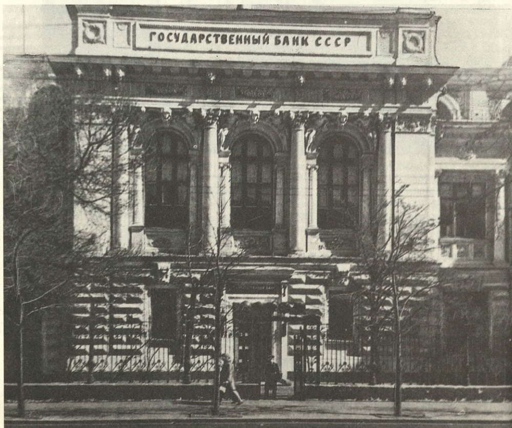
Здание Государствен- ного банка на Неглин- ной улице в Москве. Арх. К. М. Быковский

Справедливость такой оценки трудов и дней архитектора Константина Быковского подтверждена временем.