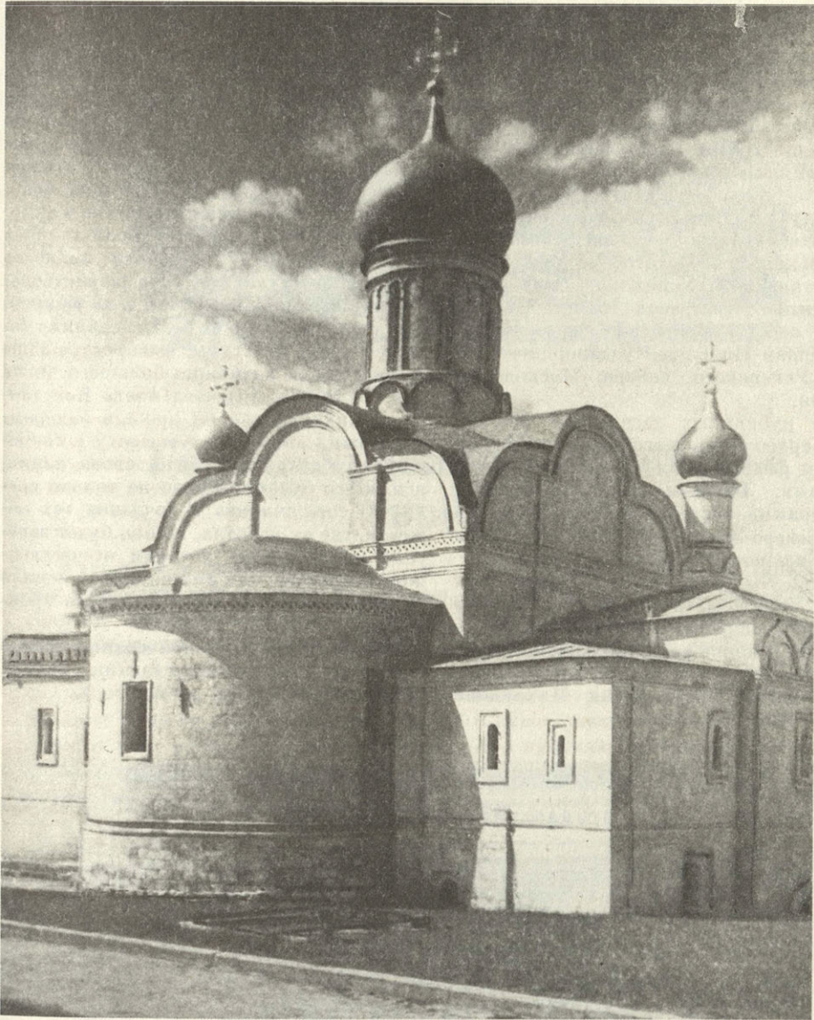
Москва. Церковь Зачатия Анны «что в углу». Построена в Зарядье у угловой башни Китайгородской стены во второй четверти XVI в. После пожара 1547 г. возобновлена

будем убеждаться в бесплодности стремлений воссоздать допетровский стиль с временными его особенностями и не будем отрекаться от наследия общечеловеческого художественного развития». Другими словами, он призывал не ограничиваться слепым копированием национальной архитектуры прошлых столетий, но глубоко осваивать мировые культурные традиции.