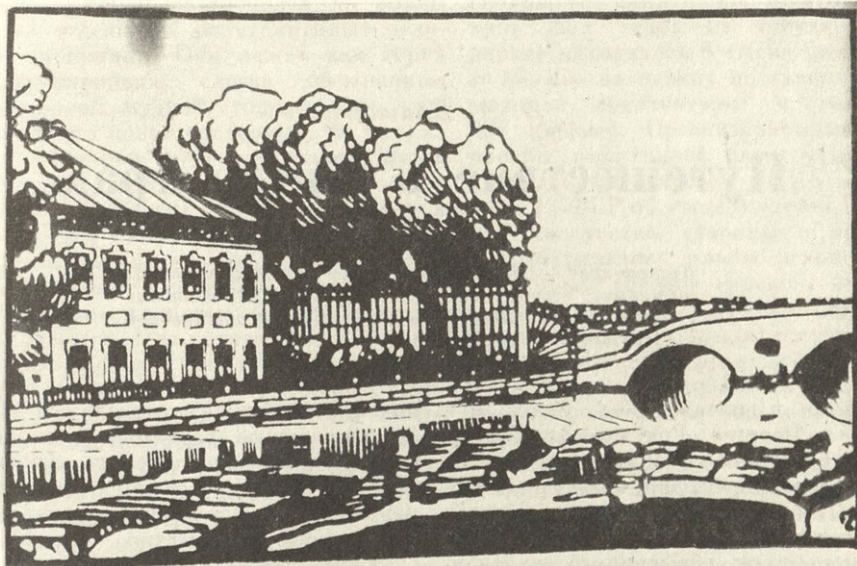
Решетка Летнего сада и домик Петра I