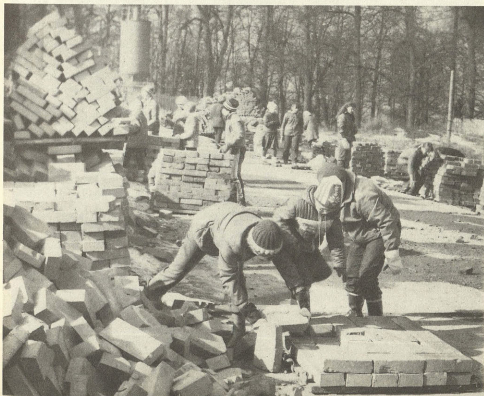
Царицыно. Укладка большемерного кирпича

Преступное небрежение к ценностям старины со стороны невежественных властей вызывало протест у русской интеллигенции, но возможность как-то реально ему противодействовать появилась, пожалуй, только с 60-х годов. В это время работа по сохранению русского культурного наследия приобрела для многих необыкновенную притягательность. Сюда тянулись люди не просто социально активные, но те, чья активность требовала для себя деятельного исхода. Поэтому возникавшие патриотические объединения с самого начала не ограничивались просвещенческой работой, но стремились к практическому делу — организовывали воскресники в помощь реставраторам памятников культуры, приводили в порядок неухоженные могилы славных сынов Отечества.