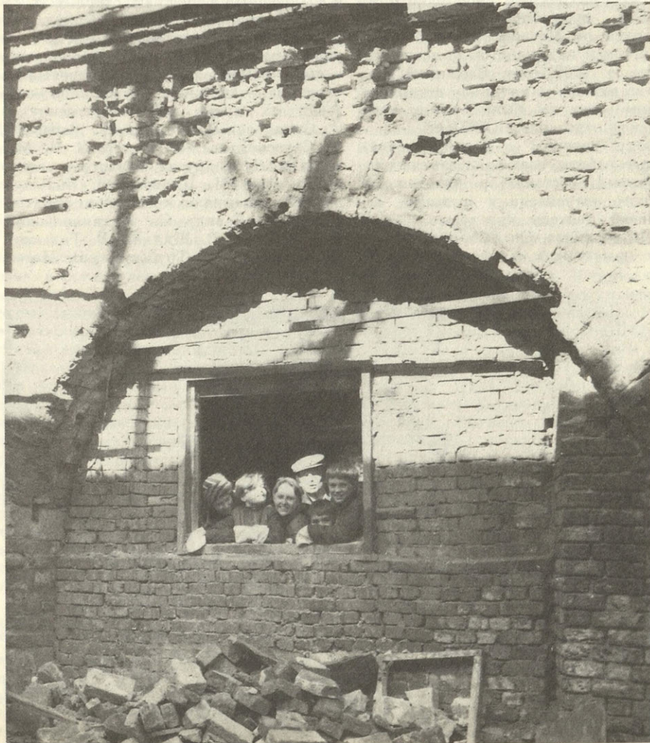
Богоявленский собор. На субботнике

Много памятников культуры разрушено, запущено, приведено в упадок, многое предстоит восстановить, возродить. Долго еще будет нужна нашим реставраторам бескорыстная помощь добровольных помощников.