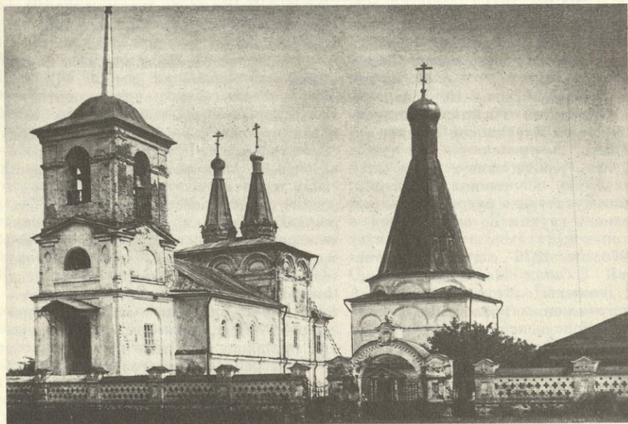
Церковь Спаса на Угре Сер. XVI в. Архив. фото 1926 г. Реставрирована на средства ВООПИК

пропаганды памятников, истории и археологии, архитектуры и искусства, молодежная, а недавно образована секция документальных памятников и народных промыслов. Активно действует общественная инспекция, чья обязанность — надзор за отношением к памятникам, к их использованию, к качеству работ реставраторов. К сожалению, не всегда сигналы общественных инспекторов доходят до органов госохраны и встречают должное понимание. Например, не удалось спасти от перестроек внутри здания памятник русского барокко храм Иоанна Предтечи. Храм был передан вроде бы подходящему арен-