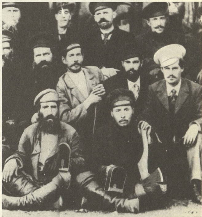
Рабочие Демидовского завода. XIX в.

— При общем понимании проблемы на всех этажах местной власти реальной помощи пока очень мало, — завершает свой рассказ Овечкин. — Как-то по-особенному врезался в память один случай. Необходимо было с отдаленного участка вывезти изложницы в качестве будущей экспонатуры. Прошу рабочих, мол, ребята, помогите — дело-то вроде святое.