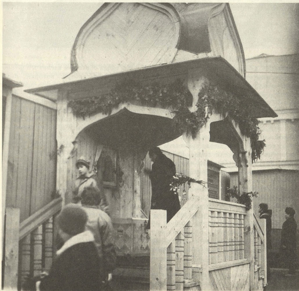
Временная деревянная часовня

Но и задолго до того здесь гремело слово неистового Аввакума: с самого же начала церковной реформы, когда Никон стал патриархом и воздвиглись гонения на ревнителей древнего благочестия, Казанский собор стал амвоном старообрядства. «Любо мне, у Казанские тое держался, чел народу книги. Много людей приходило», — читаем мы в «Житии» Аввакума. Одно время он и жил при соборе у протопопа Ивана Неронова,