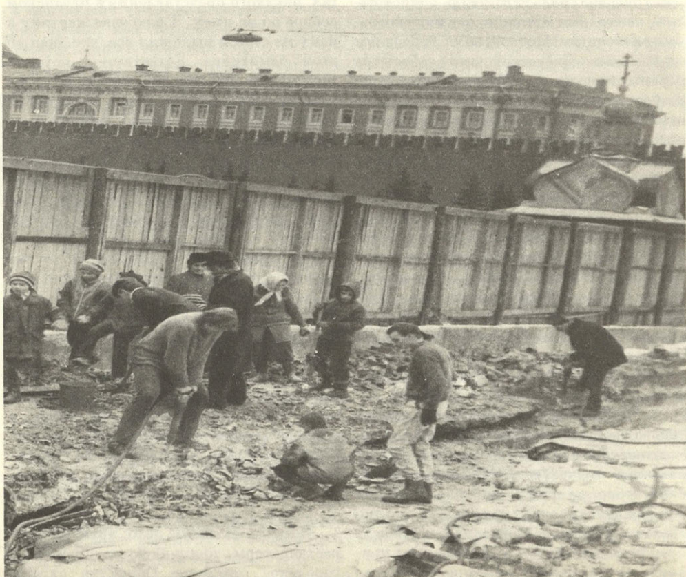
Первый субботник москвичей на территории Казанского собора