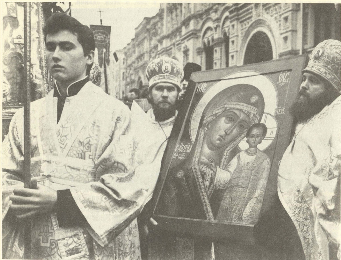
Крестный ход в честь иконы Казанской Божией Матери. Москва, 1990 г.

такого же убежденного противника никонианства: «А мне отец духовный был; ...егда куды отлучится, ино я ведаю церковь». Отказавшись служить по новому обряду, Аввакум демонстративно покинул собор, и с той поры, с порога Казанского собора, начались для мятежного протопопа его несчетные злоключения. Но и из Пустозерска, с берегов Печоры, передавались в Мезень, а оттуда в Москву его огненные писания, воспламеняли тысячи и тысячи людей. Может, и здесь Казанский собор, где, конечно же, осталась память об Аввакуме, играл свою роль?