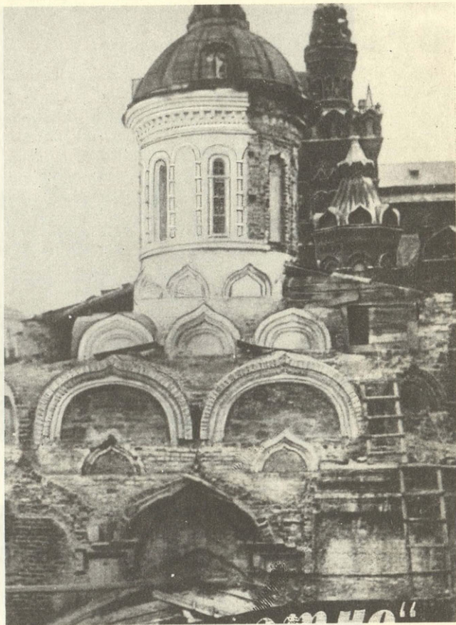
Казанский собор в процессе реставрации 1934 г.

С той давней поры установилась традиция: в день праздника иконы, а праздновался день ее обретения, 8 июля, из Успенского собора Кремля к Казанскому