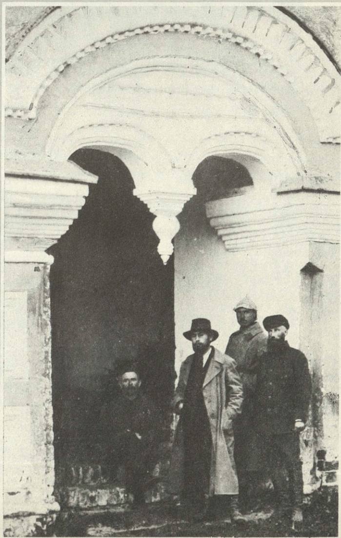
Ярославль. У портала церкви Николая Мокрого, 1918

Жил он в бездарную эпоху, жил честно, голову не склонял перед хозяевами жизни — в глаза мерзавцам говорил, что они мерзавцы. А так как мерзавцев было кругом пруд пруди, то врагов он нажил себе достаточно. Это они не позволили ему при жизни получить почет и признание, которые, увы, и нынче еще не пришли к нему в полной мере... Воздадим великому патриоту России — перелистаем с великой к нему благодарностью страницы его жизни. Вечная память, Петр Дмитриевич!