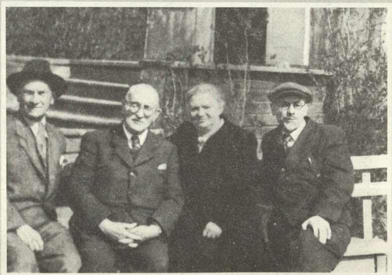
На даче И. Э. Грабара в Абрамцеве