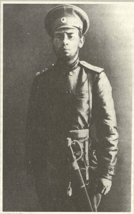
В годы первой мировой войны