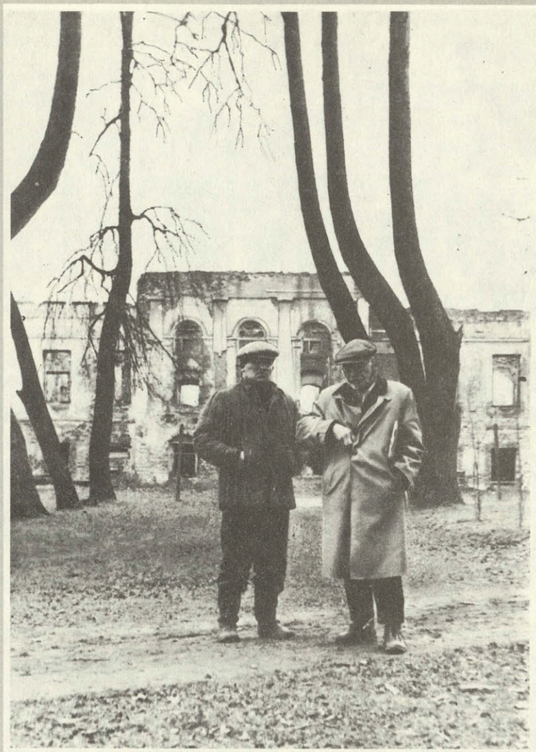
В усадьбе Хмелита, 1946