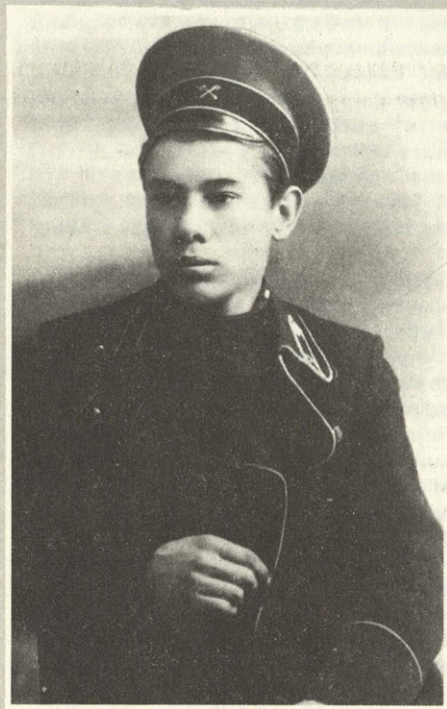
Студент строительно- технического училища. 1911