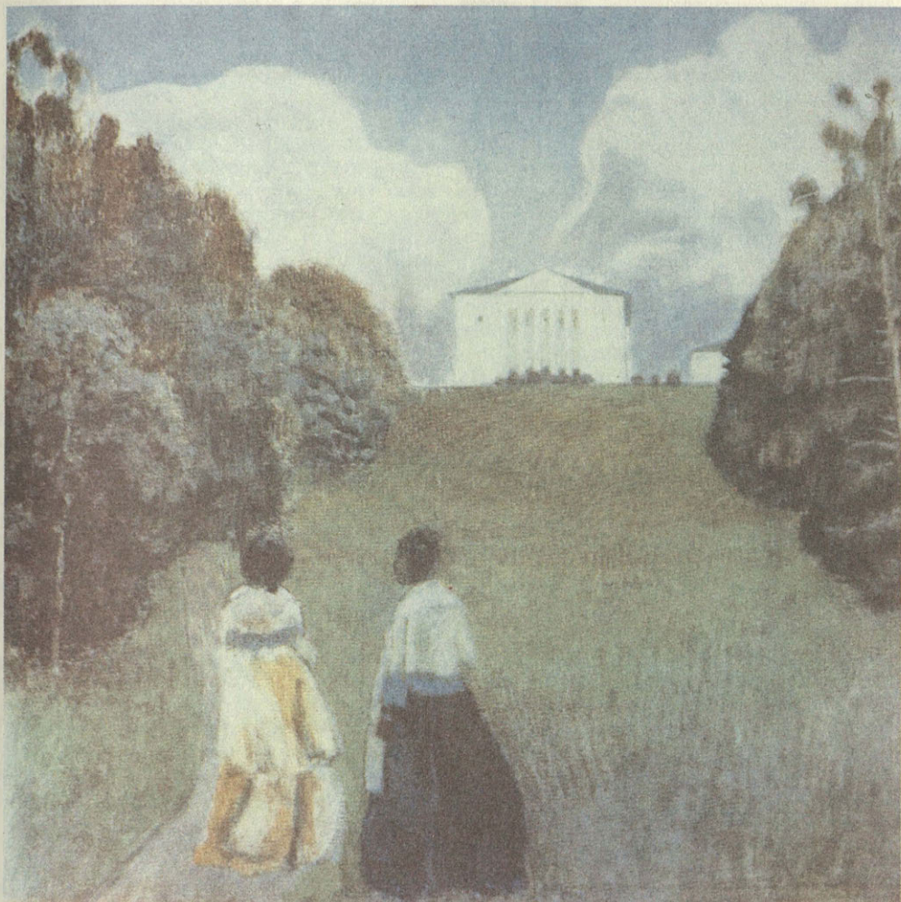
В. Э. Борисов- Мусатов. Отблеск заката. 1904