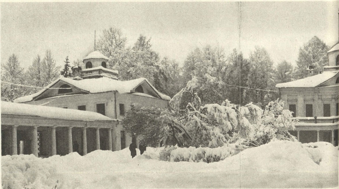
Середниково. Общий вид усадьбы

Живое сберегается в живом — можем мы сказать и об облике сохранившихся здесь исторических поселений. Все они удерживают традиционный характер планировки, тип сельского жилого дома. Это — одноэтажный сруб с четырехскатной кровлей и выходящим на уличный фасад слуховым окном, декорированным колонками и перильцами с балясинами. Эти дома датируются 20—30 гг. нашего столетия, встречаются и дореволюционные постройки. В Лигачеве два дома относятся к середине прошлого века. Очень важно сохранить традиционный облик русских деревень. Ведь испортить его ничего не стоит — вроде бы стилизацией под русскую избу. Постройку русского мужика стилизовать нельзя — получится коттедж в манере «ропет». Типовые проекты подобных коттеджей выпускаются во множестве — дома эти не европейские и не наши и только засоряют русскую сельскую архитектуру. Конечно, жизнь не остановишь, но в таких заповедных местах, как Середниковский регион, сельский дом строить надо только таким, каким он был, — воссоздавать по образам срубов, использовать традиционные материалы, традиционный крестьянский декор. Снова скажем: земля пустой не бывает, если жив на ней завет прошлого, ну а уж коли нет — безродной становится земля.