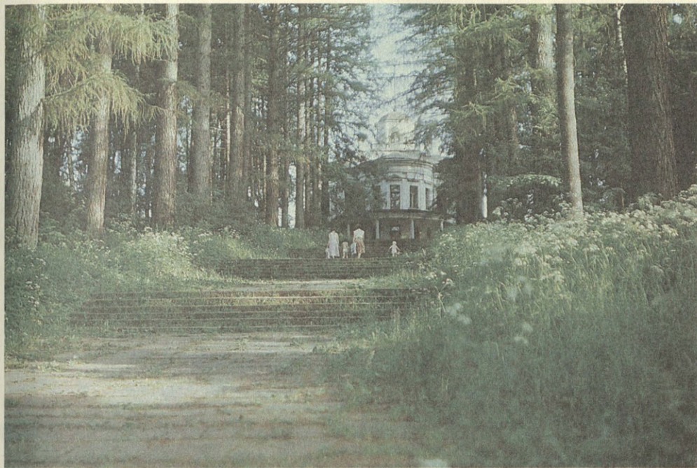
Середниково. Спуск к реке