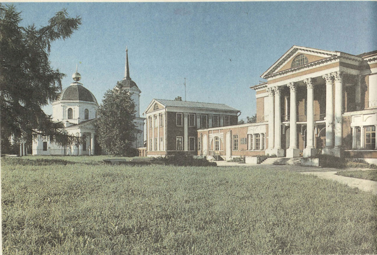
Ярополец. Усадебный дом Гончаровых. 1780

помню — идут наши господа, а с ними и Пушкин. А памятник, плита та самая, лежал на земле, вокруг него были сделаны четыре столба с навесом и кругом стояли амбары, камни навалены были. И человек долго разбирал надпись, а потом и говорит нашему барину: