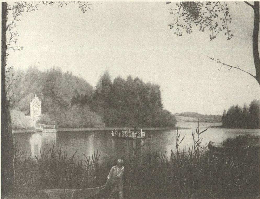
Г. В. Сорока. Вид в Островках. 1840-е гг.