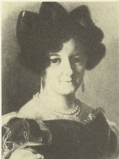
Ф. А. Тулов. Портрет неизвестной