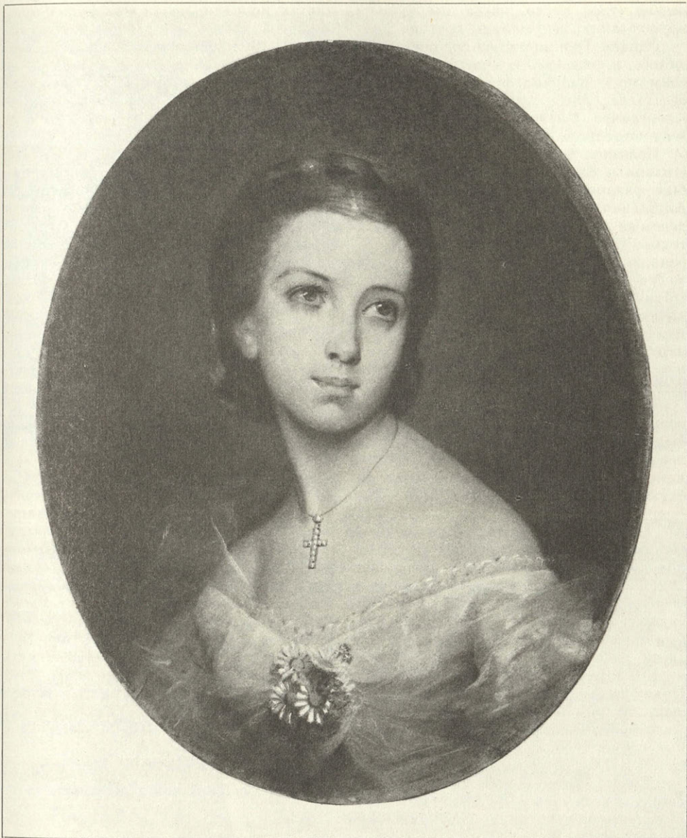
Неизвестный художник. Портрет неизвестной. XIX в. Орловская обл., картинная галерея

рел равнодушно на проявлявшееся в мальчике дарование. Отец просил графа отдать его в ученье к живописцу; но получил в ответ: «толку не будет» — и Тропинин был отдан в дом графа Заводовского, в Петербург, в ученье к кондитеру. Здесь обучался он до 1804 г. «конфектному мастерству». Вернувшись в деревню к своему барину, он, соученик Кипренского и Варнека, вынуждаем был нередко красить колодцы, стены, каретные колеса.