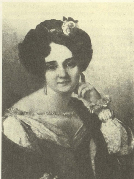
Ф. А. Тулов. Портрет неизвестной