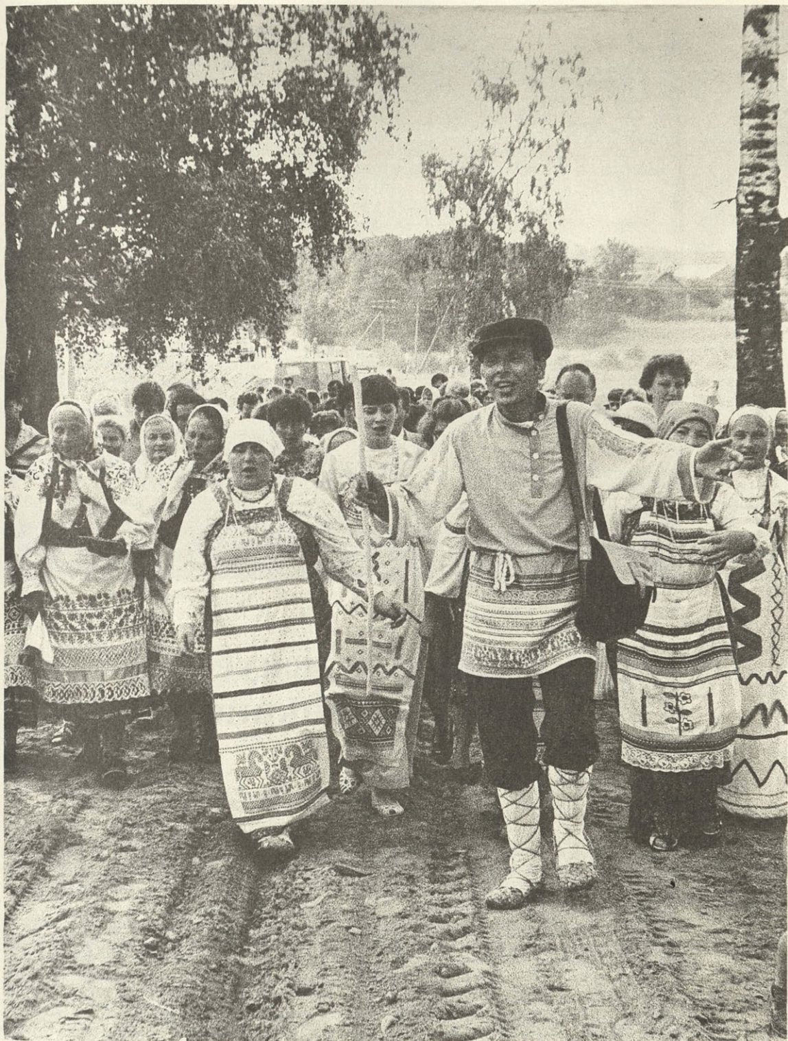
Хмелита. Празник в усадыбе Совр. фото