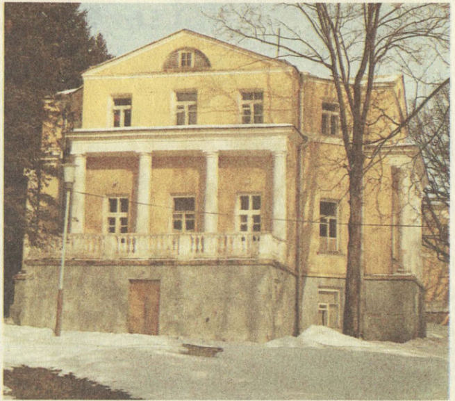
Флигель усадебного дома

По семейному преданию, Карамзин любил гулять в старой березовой роще за усадебным парком; поэтому на протяжении всего прошлого века ее так и называли — карамзинская роща. Кабинет историка находился на втором этаже, окном в парк. «Служенье муз не терпит