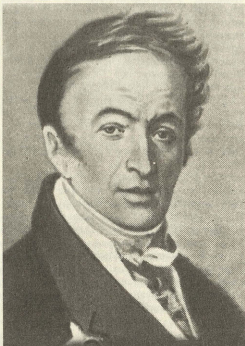
Н. М. Карамзин

«В семи верстах от уездного города Подольска Московской губернии, недалеко от старой калужской дороги...»