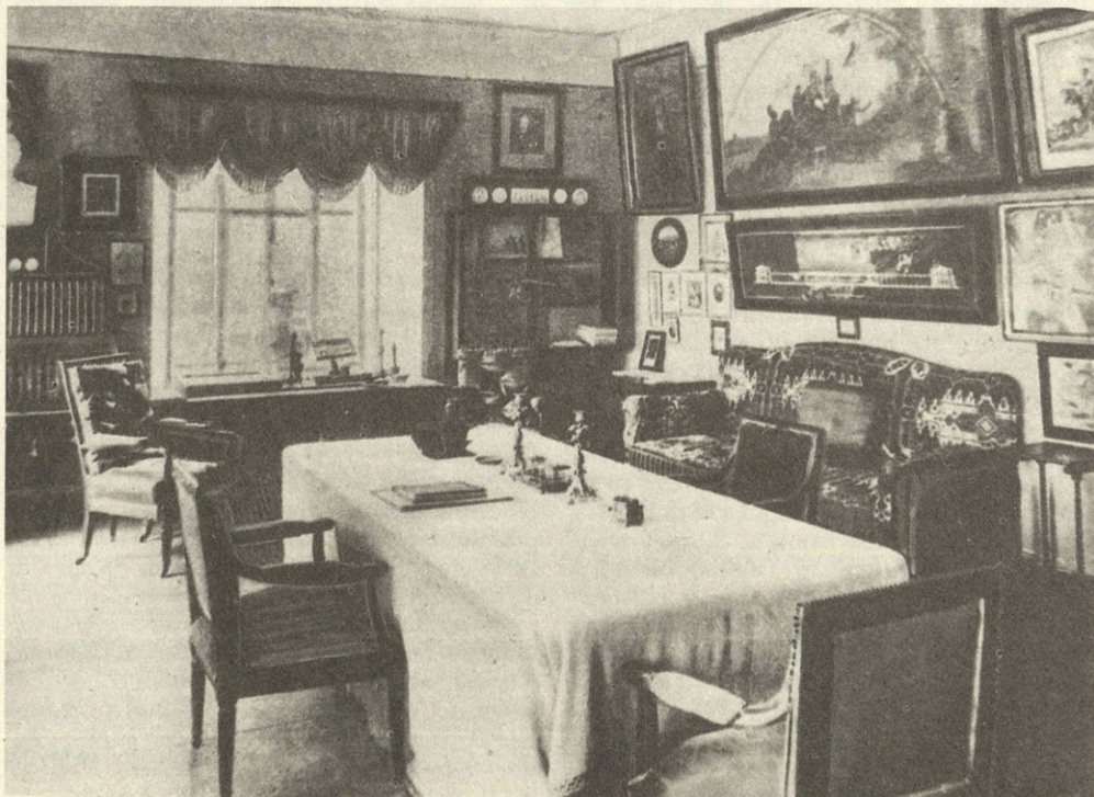
Главный усадебный дом Карамзинская комната. Фото 1907 г.

«Письма русского путешественника» обладают нестареющим обаянием, и тайна его — в самой личности Карамзина. О своем путешествии рассказывает умный, доброжелательный, любознатель-