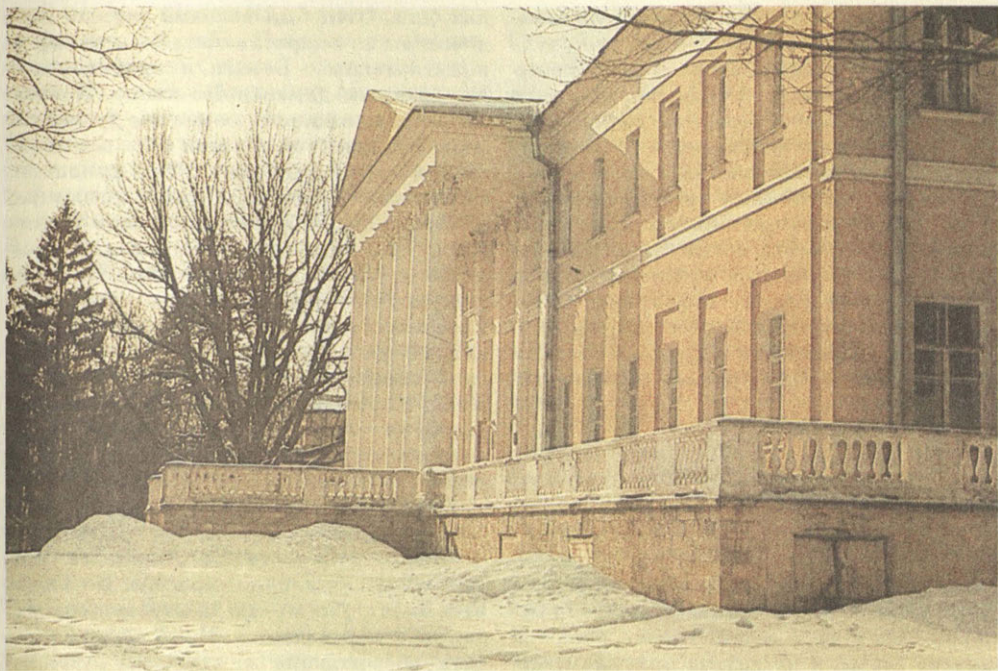
Остафьево. Главный усадебный дом

женитьбой стареющего князя Вяземского на жизнерадостной ирландке Евгении О'Рейли, которую он встретил во время одного из своих зарубежных вояжей, увез от мужа в Россию и с большими трудами добился для нее развода. (Она и стала матерью будущего поэта.) Мезальянс рассорил его с родственниками. В пику им князь Андрей Иванович продал наследственное имение Удино под Дмитровом и взамен купил Остафьево. Не терпевший праздности, он сразу же энергично приступил к переустройству усадьбы. Есть все основания считать, что ему удалось привлечь одного из крупнейших архитекторов того времени — Старова, кстати, много строившего в Подмосковье. Хотя документально это не подтверждается, но остафьевский палаццо несет на себе характерные черты художественного почерка знаменитого зодчего.