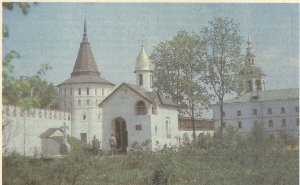
Поминальная часовня. Архитектор Юрий Алонов. 1988 г. Commemoration Chapel. Architect Yuri Alonov. 1988