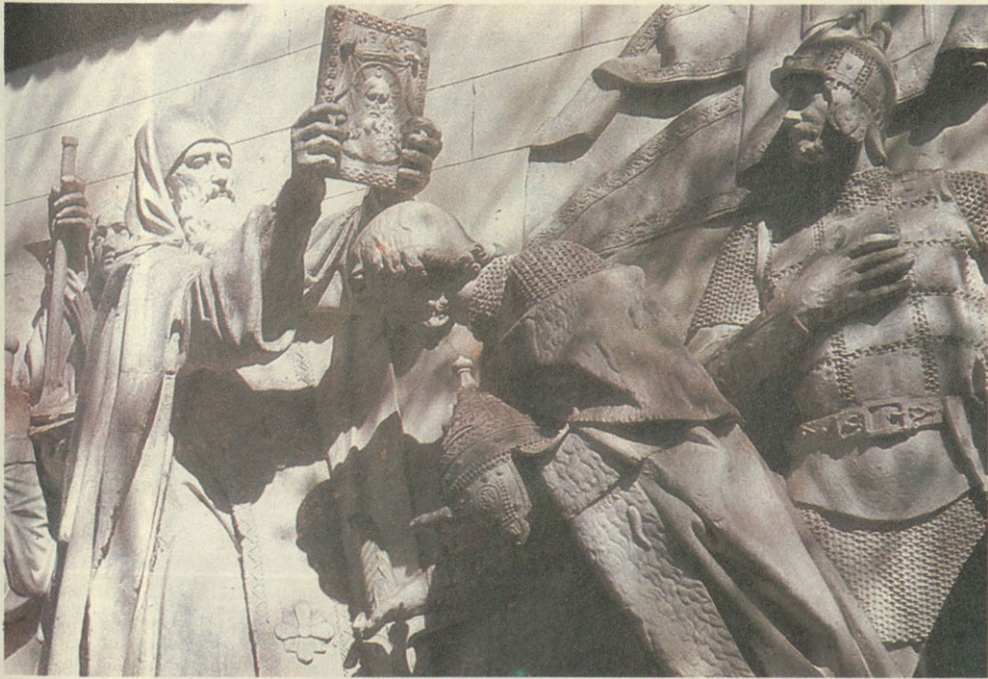
Св. Сергий Радонежский благословляет великого князя Дмитрия на битву с ордынцами. Горельеф разрушенного храма Христа Спасителя в Москве. Находится в Донском монастыре. St. Sergius of Radonezh blessing Grand Prince Dmitry before the battle with the Golden Horde. High relief from the destroyed Church of the Saviour in Moscow. Kept at the Donskoi Monastery