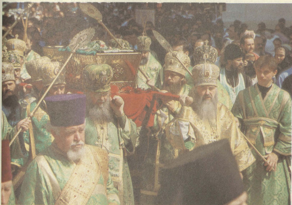
Перенос мощей преп. Серафима Саровского. 1991 г.