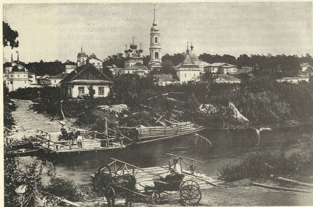
Переправа через реку Жиздру возле Оптиной пустыни. Фотография нач. XX в.

Ford across the Zhizdra River near the Optina Hermitage. Photo of the early 20th-century