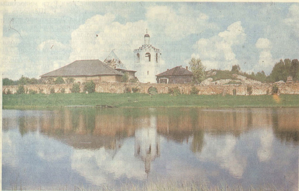
Болдин монастырь