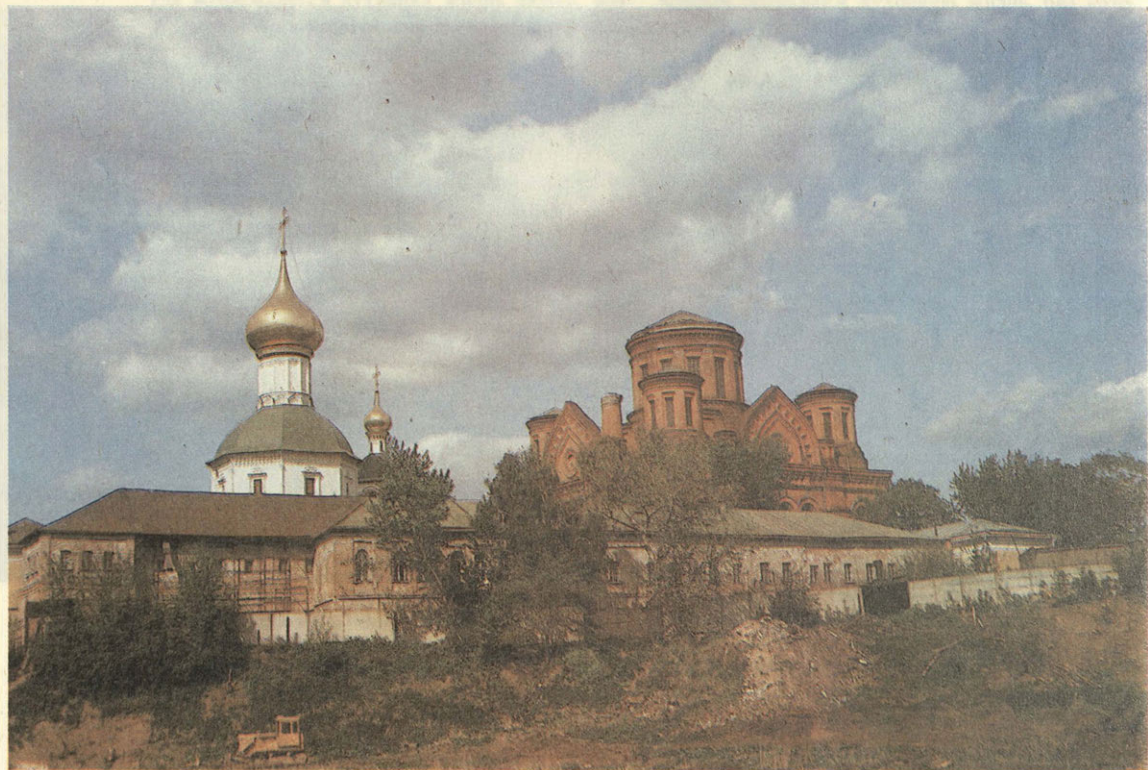
Вид Николо-Перервинского монастыря