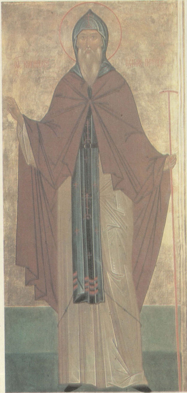
Св. Корнилий Псковский. Работа о. Зинова St. Kornily of Pskov. Icon by Father Zenon

богословский, так же как изучение Священного Писания.