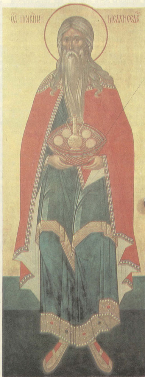
Св. Мелхиседек. Работа о. Зинова St. Melchisedec. Icon by Father Zenon

Несмотря на то что и Стоглавый, и Большой Московский Соборы запретили подобные изображения, их продолжали писать. Они заняли место чуть ли не в каждом храме и не в каждой иконной лавке. Даже в восстановленном Даниловом монастыре, когда заново создавали иконостас для храма Святых Отцов Семи Вселенских Соборов, был написан образ «Отечество». А ведь в этом монастыре почти все насельники с высшим богословским образованием, которые обязаны знать все тонкости вероучения. Существуют четыре иконы Святой Троицы. Они указаны в чине благословения этих икон в нашем требнике. Это ветхозаветное явление Аврааму (в образе трех ангелов), Сошествие Свя-