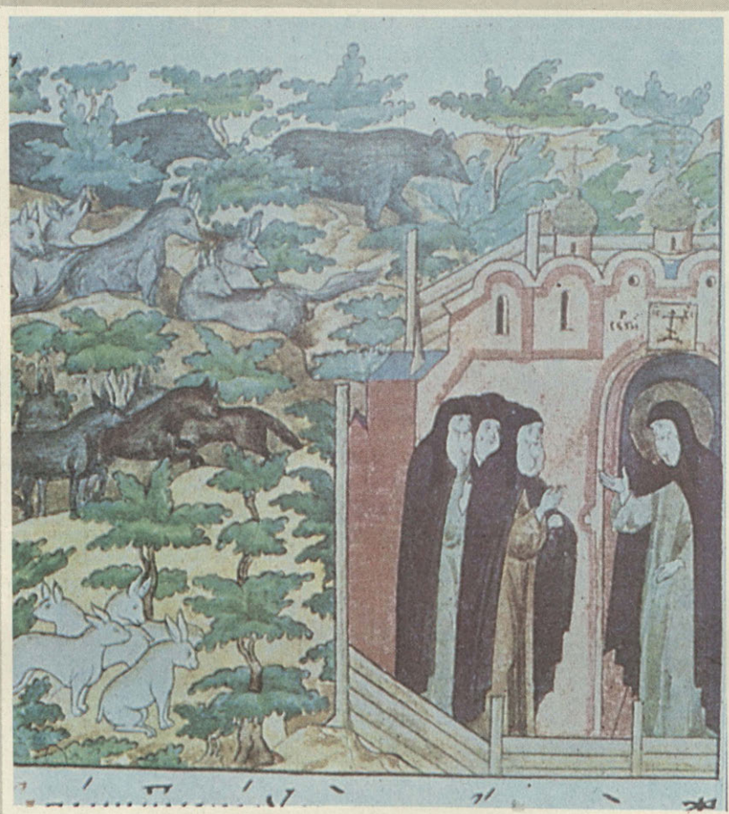
Пустынножи- тельство Сергия Радонежского. Миниатюра XVI в.

Архимандрит, писатель и ученый, каждый по-своему, рассказывают о жизни монастыря