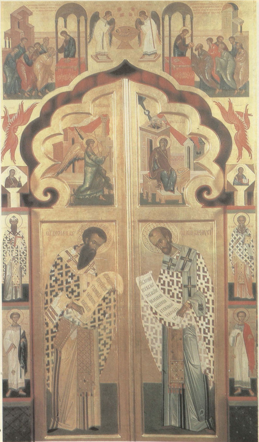
Царские врата с изображением Василия Великого и Иоанна Златоуста. Работа о. Зинова