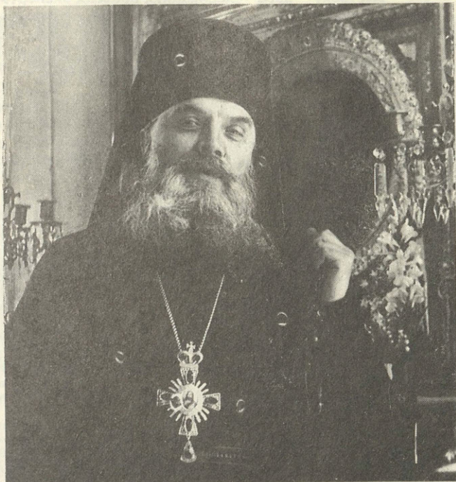
Архимандрит Алипий Archimandrite Alipiy