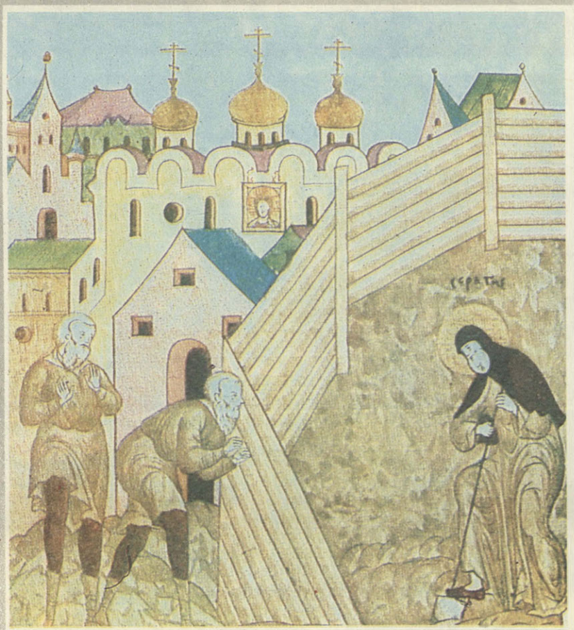
Смирные труды св. Сергия. Миниатюра XVI в. Feats of St. Sergius. 16th-century miniature

В монастырях нередко создавались великие произведения искусства. Вспомним хотя бы фрески Дионисия в Ферапонтове или Троицу и Звенигородский чин Рублева. А какая утварь, какие богатые библиотеки! Силуэты Соловков, Кирилло-Белозерского или Иосифо-Волоколамского монастырей украшают все учебники архитектуры. И неслучайно русские художники так часто рисовали, писали стены и башни монастырские. Закрывая монастыри, советская власть их легко превращала в музеи, потому что они уже были ими