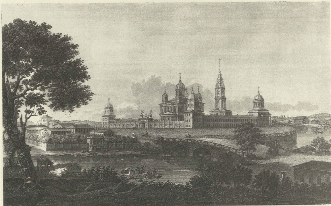
Вид Югской Дорофеевой общежительной пустыни близ Мологи (затоплена Рыбинским водохранилищем)