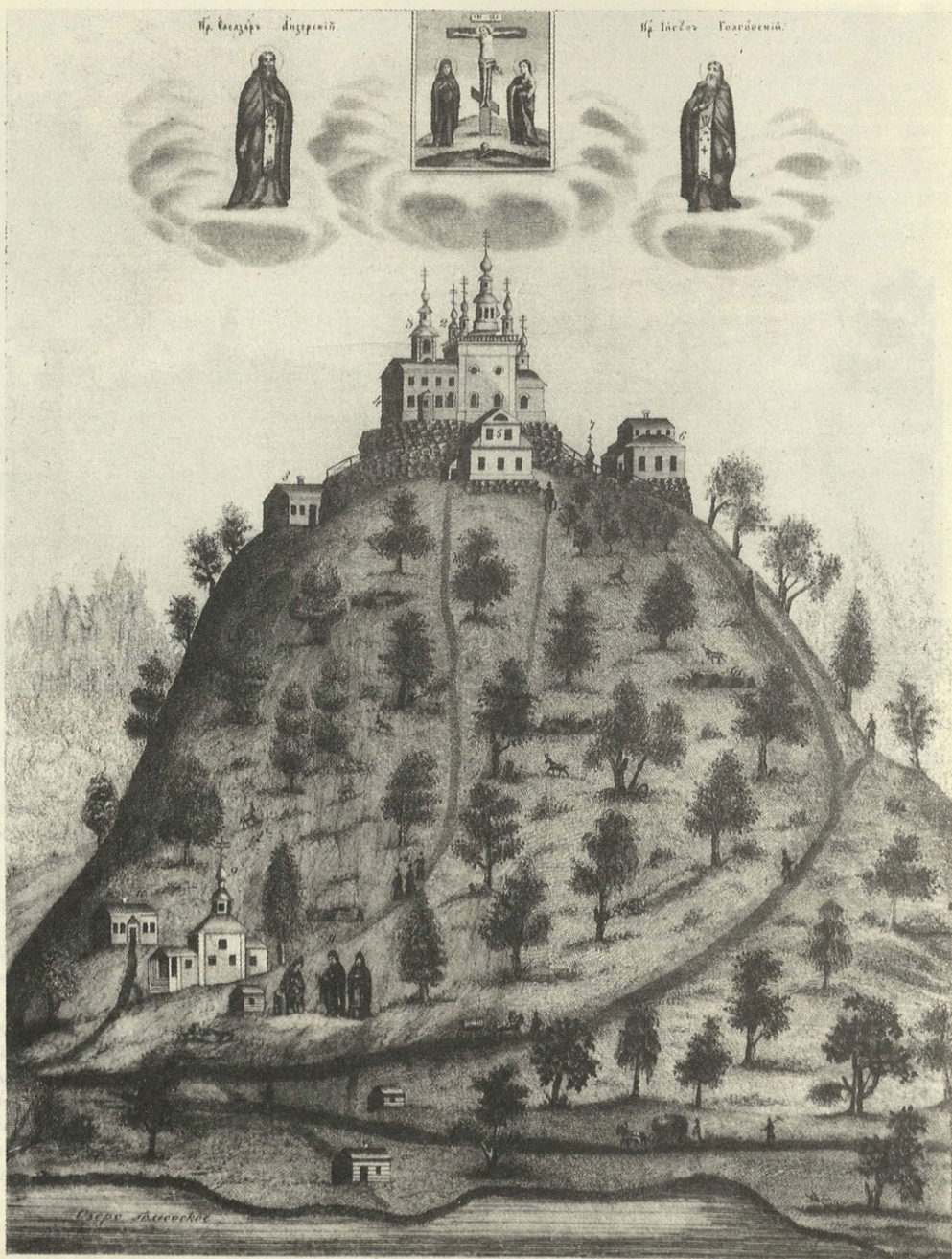
Свято-Распятский скит на Анзерском острове на горе Голгофе (Соловецкий архипелаг)

The Skete of the Holy Crucifixion on the Colgotha Hill, the Anzer Isle (Solovki Archipelago)