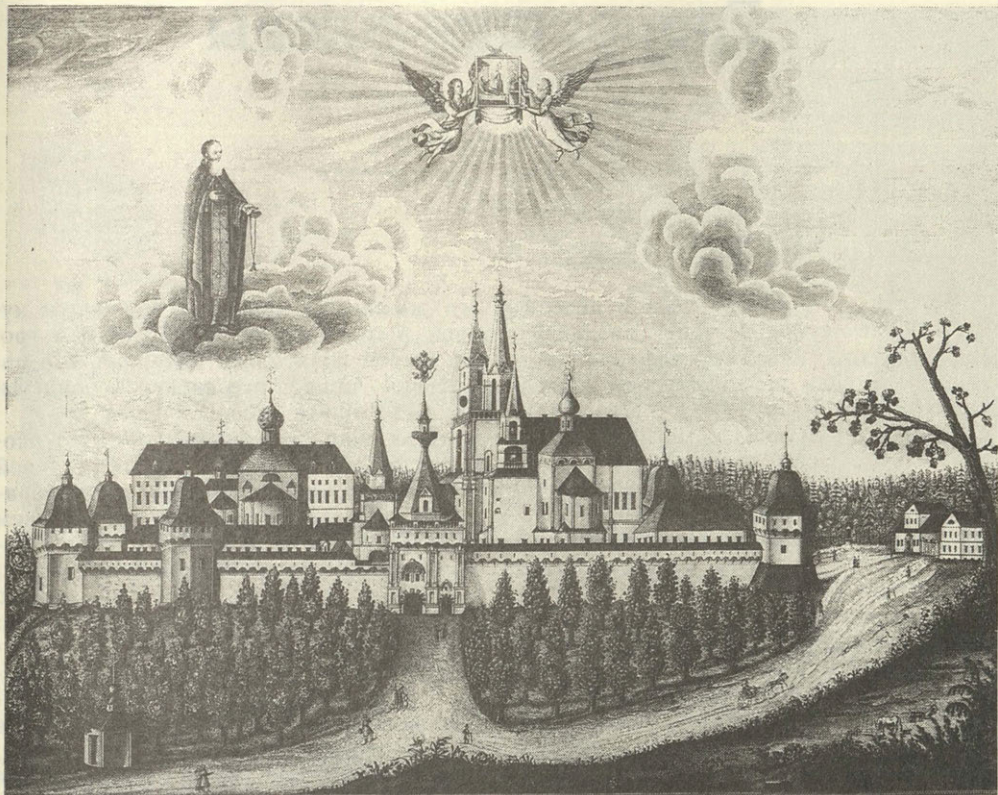
Вид Звенигородского Саввино- Сторожевского монастыря под Москвой View of the Savvino- Storozhevsky Monastery in Zvenigorod near Moscow