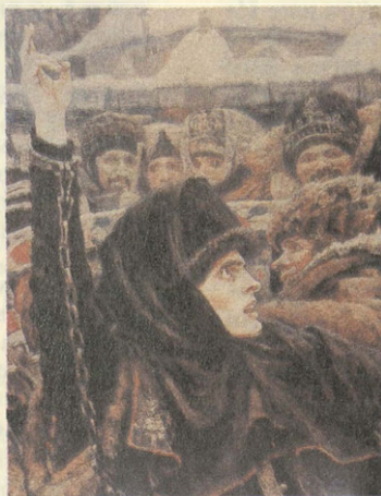
В. И. Суриков Боярыня Морозова Фрагмент

Боярыня Федосья Прокопьевна Морозова была супругою Глеба Ивановича Морозова, одного из первых бояр при царе Алексее Михайловиче. ...Федосья Прокопьевна вышла замуж 17 лет. Глеб Морозов был уже человеком пожилым, имел по крайней мере лет 50. Неравенство лет не могло, конечно, остаться без влияния на жизнь молодой боярыни. Мы не знаем обстоятельств ее замужней жизни, но, имея в виду общий склад тогдашнего домашнего быта бояр, можем предположить, что дом такого степенного, богобоязненного и тихого боярина, каким был действительно Глеб Иванович, скорее, чем другие, должен был служить наиболее