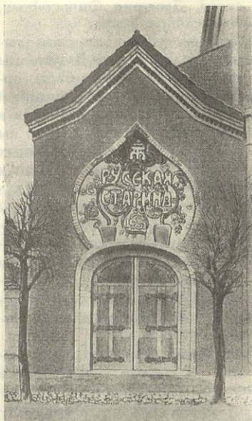
Музей «Русская старина» в Смоленске Фрагмент фасада

Вместе с мужем Мария Клавдиевна организовывала и представляла Русский отдел на Международной выставке в Париже в 1900 году. Правительство назначило князя Тенишева комиссаром выставки. На его плечи легли технические и финансовые во-