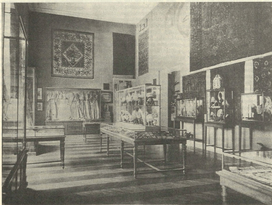
Экспозиция тенишевского музея в Лувре. 1907 г.