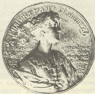
Медаль в честь передачи музея «Русская старина» смоленскому филиалу Московского археологического института

Красивая, образованная, живая, с острым веселым языком, щедрая от избытка сил и дарований, которыми не жаль ей было поделиться со всеми, кто нуждался в поддержке и был достоин ее внимания.