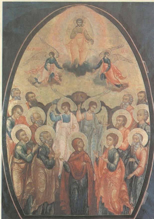
Вознесение. XVIII век. 74×53