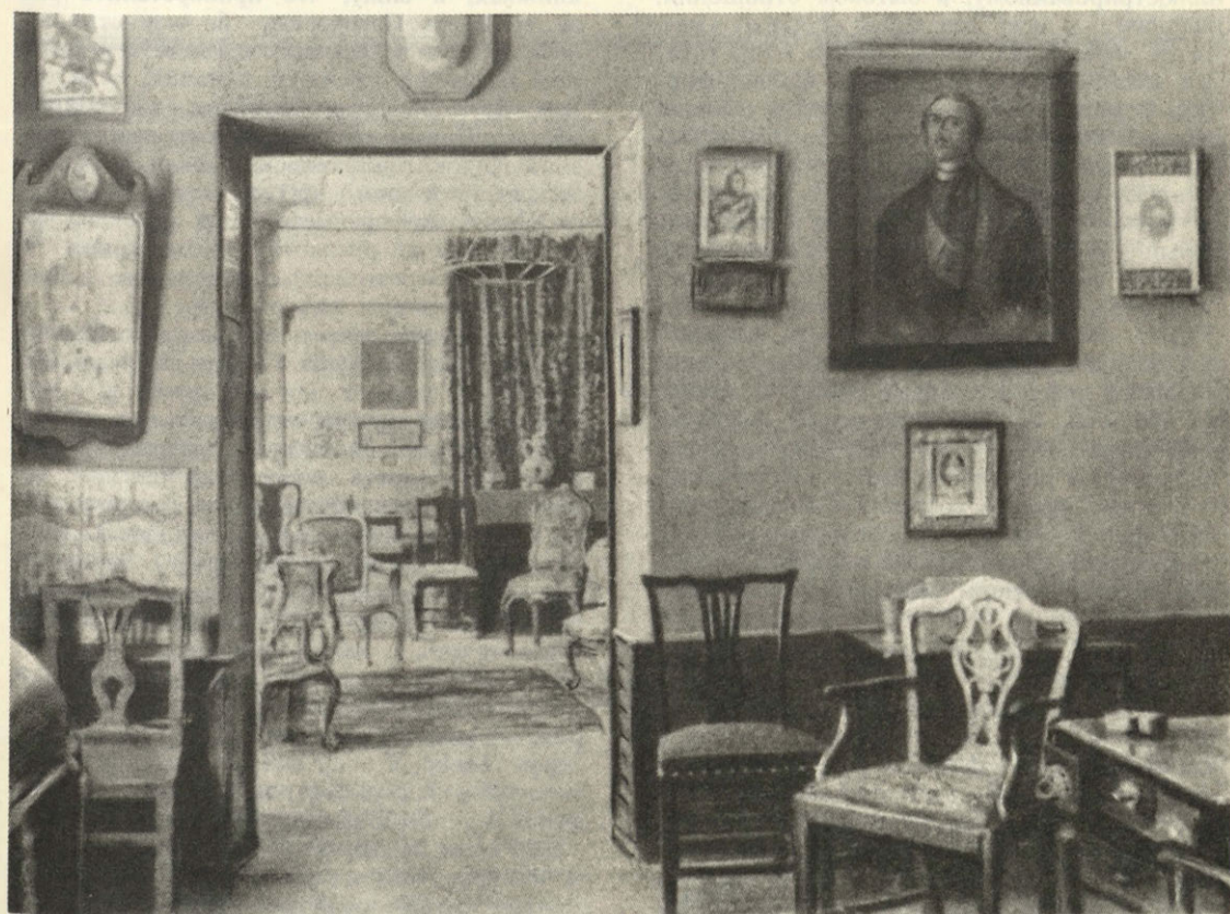
Петровская комната «Старого Домика» (Музей Ю. Э. Озаровского)