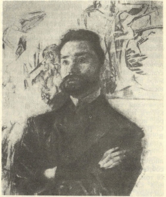
М. А. Врубель. Портрет Валерия Брюсова