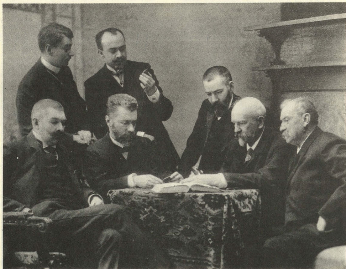
Заседание коллекционеров в доме Зубовых