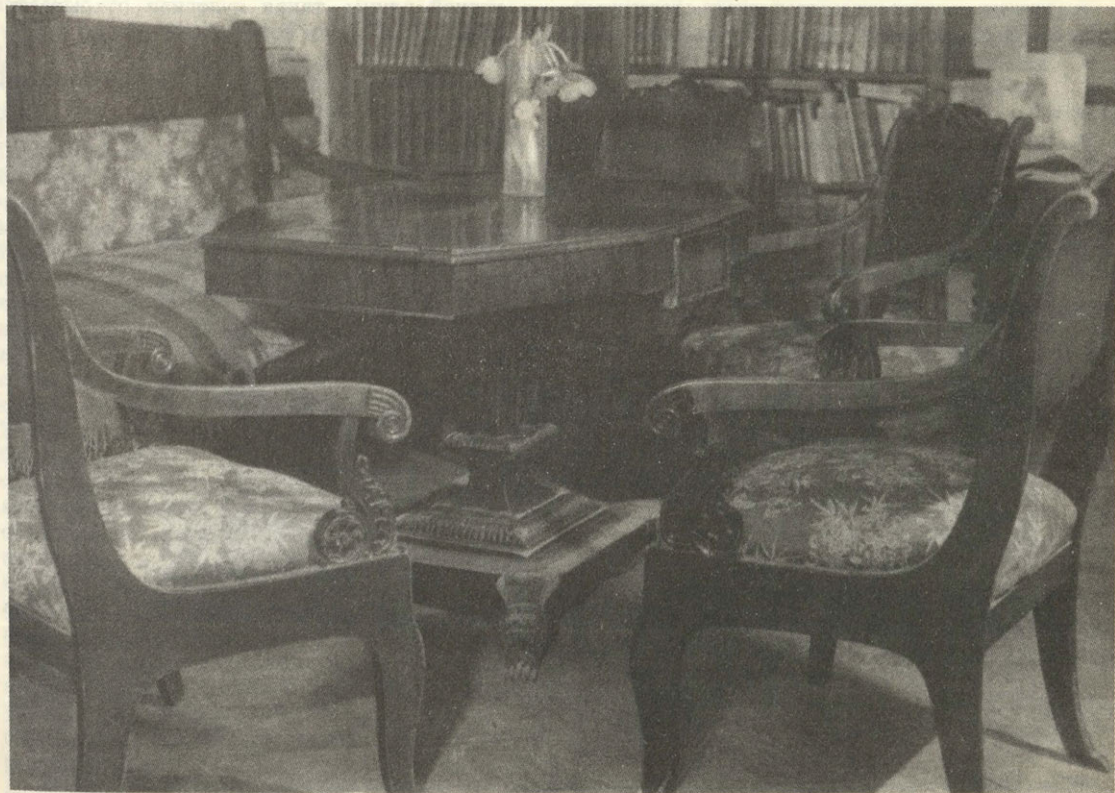
Гостиная в доме Зубовых