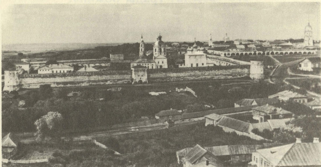
Зарайск. Вид на город. Фото 1920 г.

ло акценты в восприятии архитектуры. Открывающиеся из города далекие виды на живописные окрестности были его художественной доминантой и даже первопричиной. Таков главный родовой признак любого древнерусского города — и малого, и большого, тем более столичного. Природа живо ощущалась в самом центре Москвы еще во времена П. Вяземского: