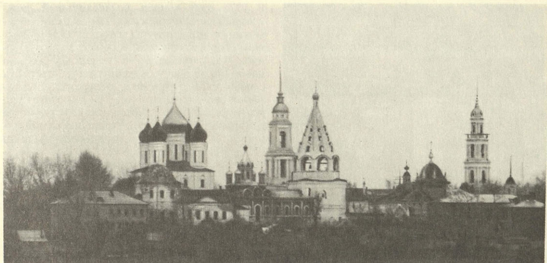
Коломна. Успенский собор и Старо-Голутвин монастырь.

вописно расположенные подгородние села и монастыри, разделенные еще большим пространством полей и рощ; затем леса чередовались с полями и лугами, деревни и села с погостами и пустошами, за ними постепенно начинался другой город... И все было единым одухотворенным пространством. В одной части было больше «природы», в другой больше «неприроды»; были видны главные и второстепенные, архитектурные сооружения ведущие и рядовые. Словом, в историческом ландшафте существовала четкая иерархия пространств, которая, с одной стороны, исключала какое-либо однообразие, с другой — поддерживала удивительное равновесие и единство.