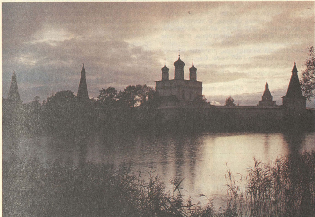
Вид на Иосифо-Волоколамский монастырь.