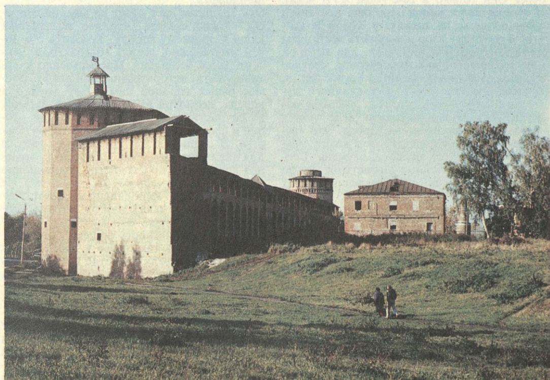
Коломна. Кремль. Крепостная стена.