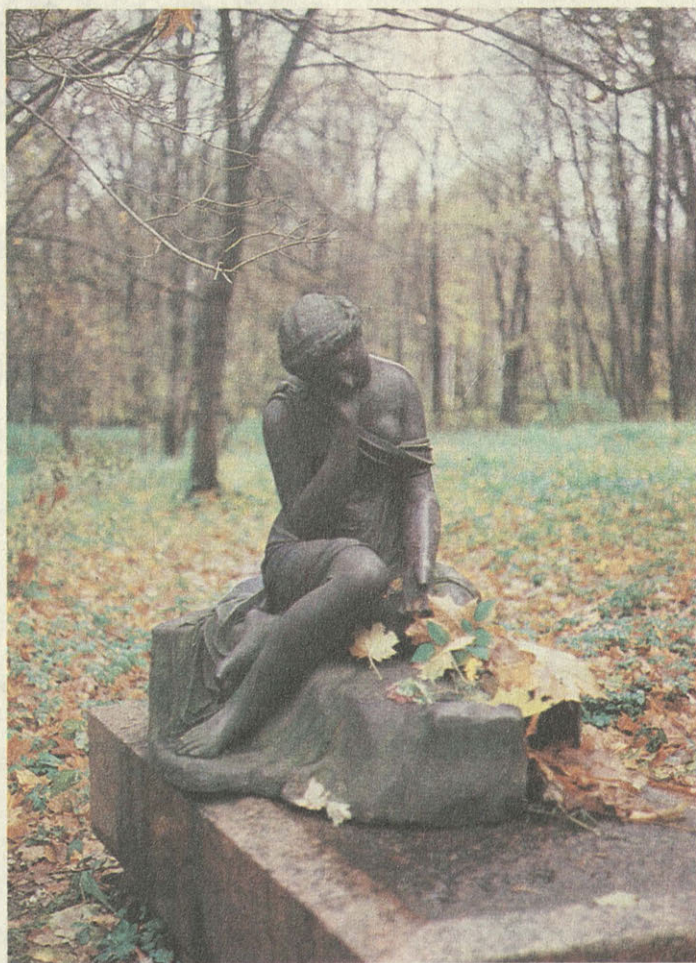
Уголок парка в усадьбе Суханово