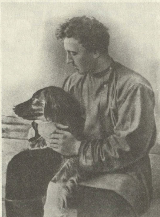
Шахматово. Александр Блок