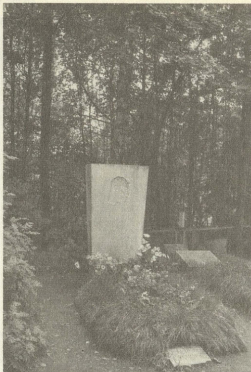
Могила Б. Пастернака в Перedelкине

Из цикла «Перedelкино», книга «На ранних поездах»