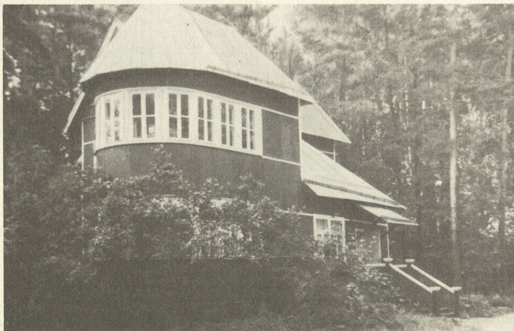
Перedelкино. Дом Б. Пастернака. 1986 г.