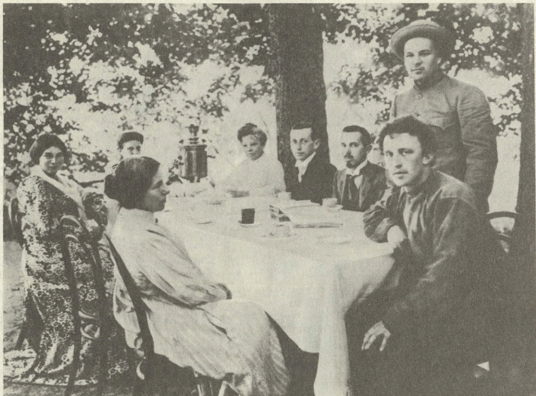
В Шахматове. Фото 1909 г.