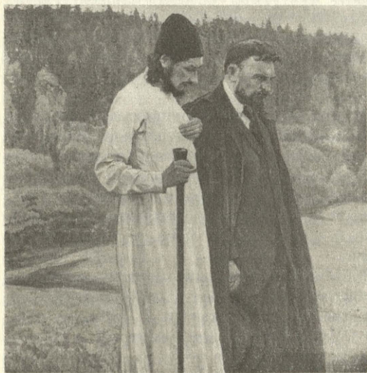
М. В. Нестеров. Философы. 1917.

...Вот уже пять дней, как я в деревне, или, точнее, в монастыре, или — того точнее, в монастырской гостинице, в 2–3 верстах