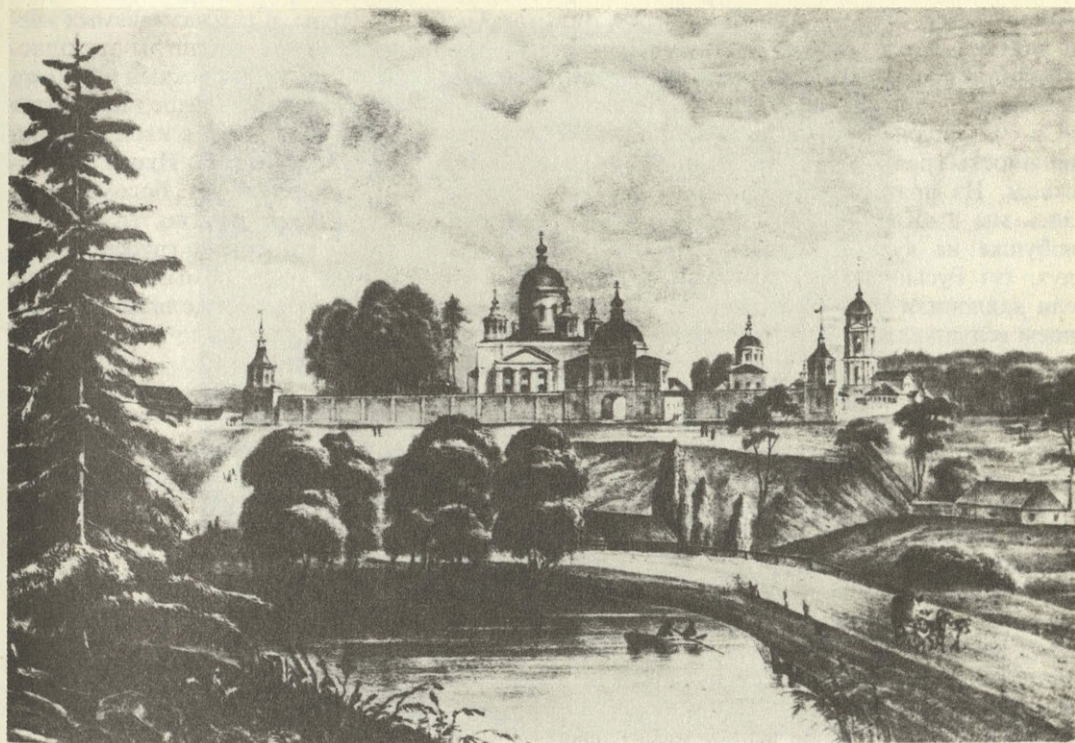
Вид на Николаевско-Берлюковскую пустынь

ходите на небольшую поляну, посреди которой стоит чудо-церковка. Она не более Никольской часовни. Архитектура ее XII века, по типу она целиком напоминает древние церкви Ростова и Пскова. Каждая деталь, начиная с купола до звонниц и окон, высокохудожественна.