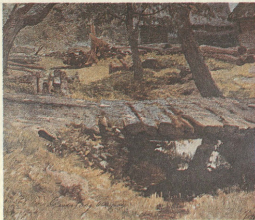
И. Левитан. Мостик