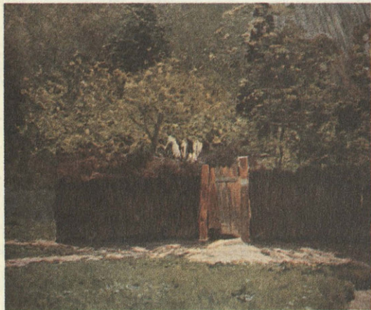
И. Левитан. Первая зелень. Май