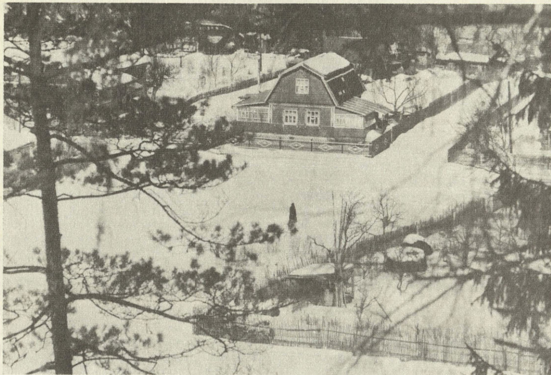
Дютьково. Звенигородский р-н.

реть-то, казалось, не на что — а глаз не оторвешь! Художник подсмотрел нечто ранее неведомое, прекрасное и спешит показать все это людям. И мы стоим перед этим холстом в удивлении и восторге, словно впервые увидели этот кусочек природы Подмосковья.