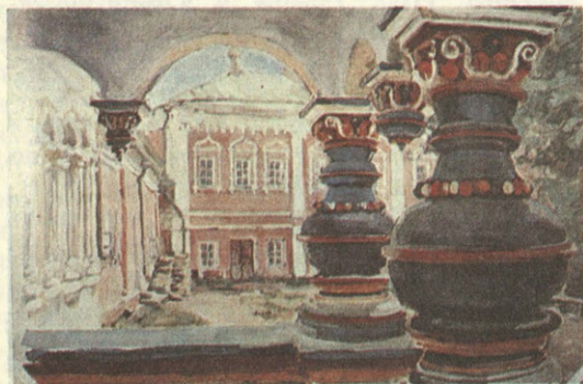
М. В. Якунчикова. Монастырские ворота. Саввино-Сторожевский монастырь близ Звенигорода

жизни в слободке под Саввиным монастырем,—пишет она,—Левитан сильно страдал от невозможности выразить на полотне все, что бродило неясно в его душе. Однажды он был настроен особенно тяжело, бросил совсем работать, говорил, что все для него кончено и что ему не для чего больше жить, если он до сих пор обманывался в себе и напрасно воображал себя художником... Будущее представлялось безотрадно мрачным, и все мои попытки рассеять эти тяжелые думы были напрасны. Наконец я убедила Левитана уйти из дому, и мы пошли по берегу пруда, вдоль монастырской горы. Вечерело. Солнце близились к закату и обливало монастырь горячим светом последних лучей, но и эта красивая картина не разбудила ничего в душе Левитана.