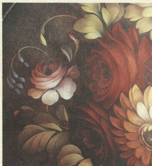
Фрагмент жостовского подноса

Опытный мастер ведет роспись без видимых усилий. Но подобная легкость обманчива. Она говорит лишь о высоком артистизме, за которым и долгие годы поиска своего собственного букета, и уверенное владение специфическими приемами жостовской росписи, сложившимися далеко не вчера.