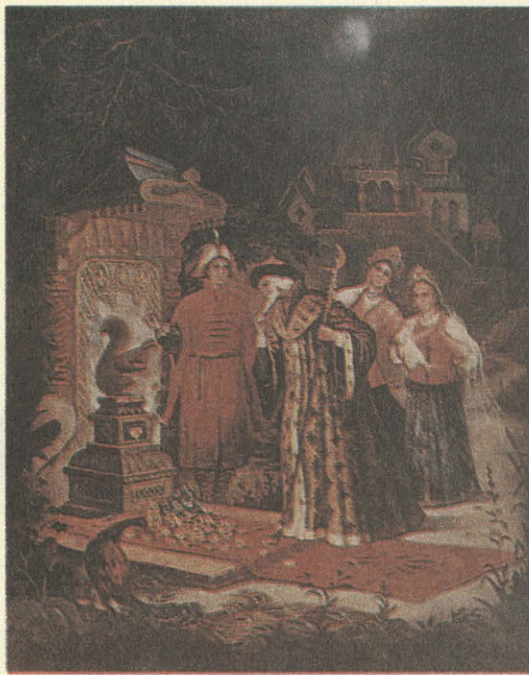
Федоскино. Сказка о царе Салтане. Шкатулка. Художник А. И. Козлов