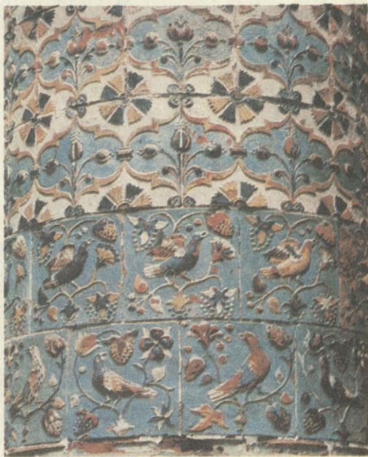
Изразцы. Иосифо-Волоколамский монастырь