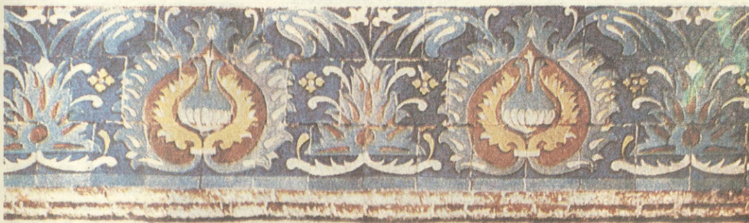
Изразцовый фриз. Ново-Иерусалимский монастырь