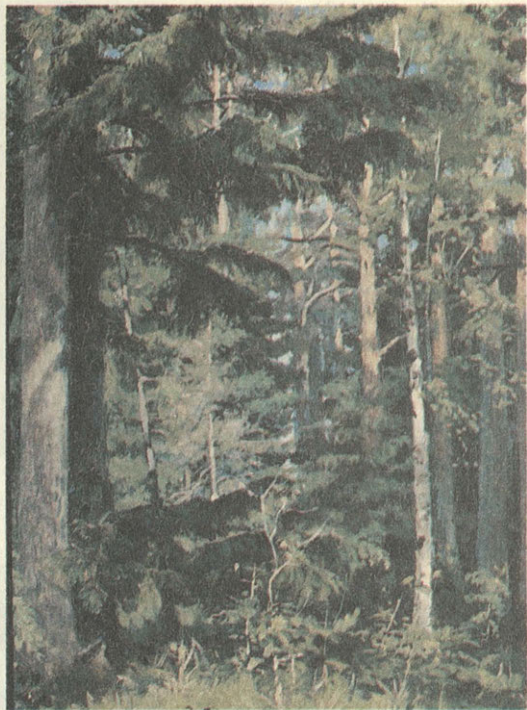
А. М. Васнецов. Лес