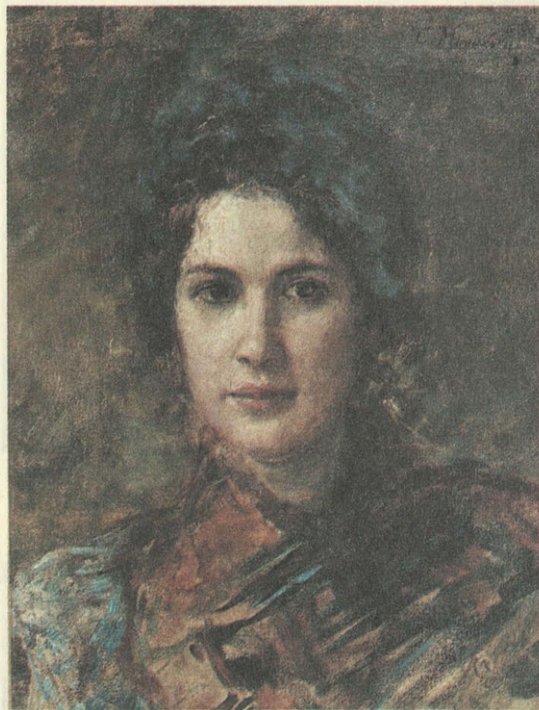
К. Е. Маковский. Портрет молодой женщины