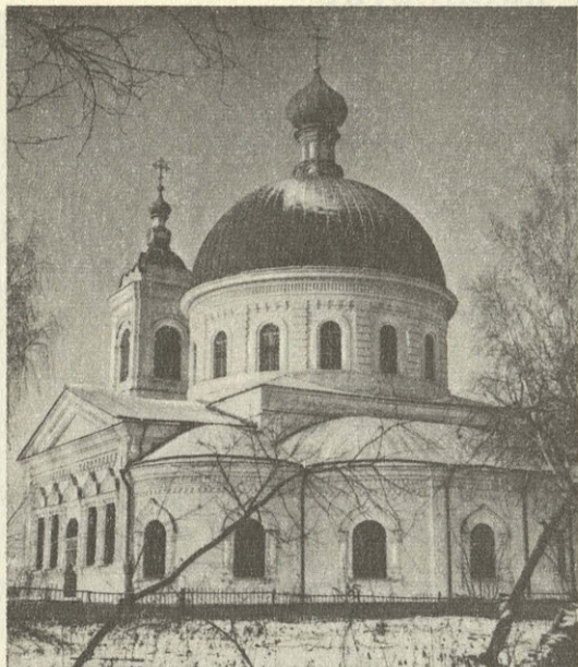
Церковь Преображения в селе Савино