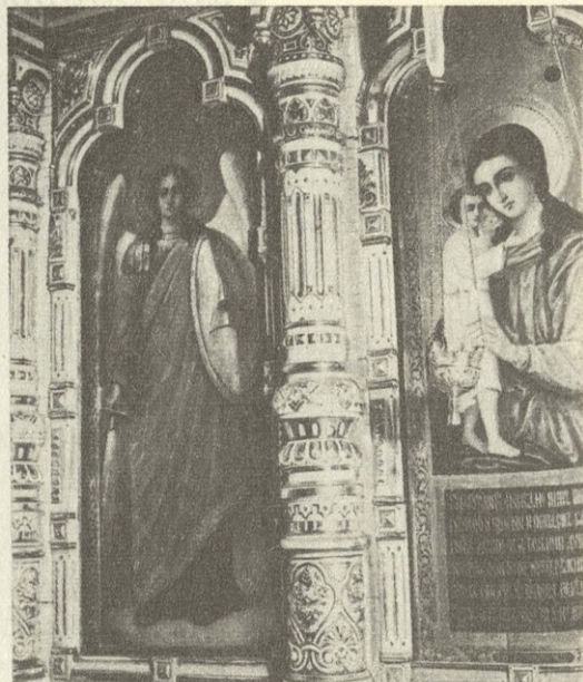
Фрагмент иконостаса церкви Преображения в селе Савино