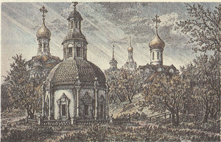
«Сергиев Посад. Пятницкий колодец». Офорт Валерия Власова