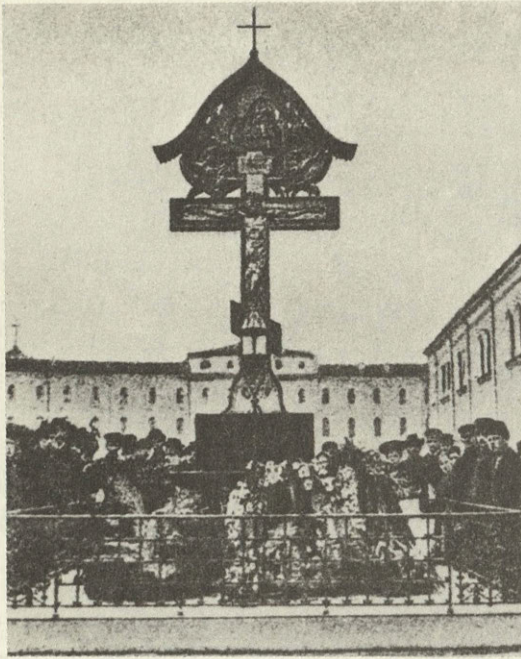
Крест-памятник в Кремле на месте гибели Великого князя Сергея Александровича. Репродукция с фотографии 1908 г.