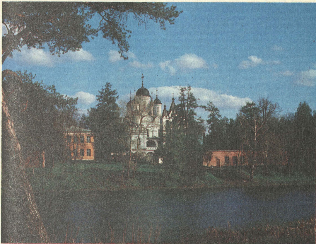
Усадьба Большие Вяземы.