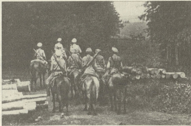
Части колчаковской армии в походе. 1918 — январь 1920 г.