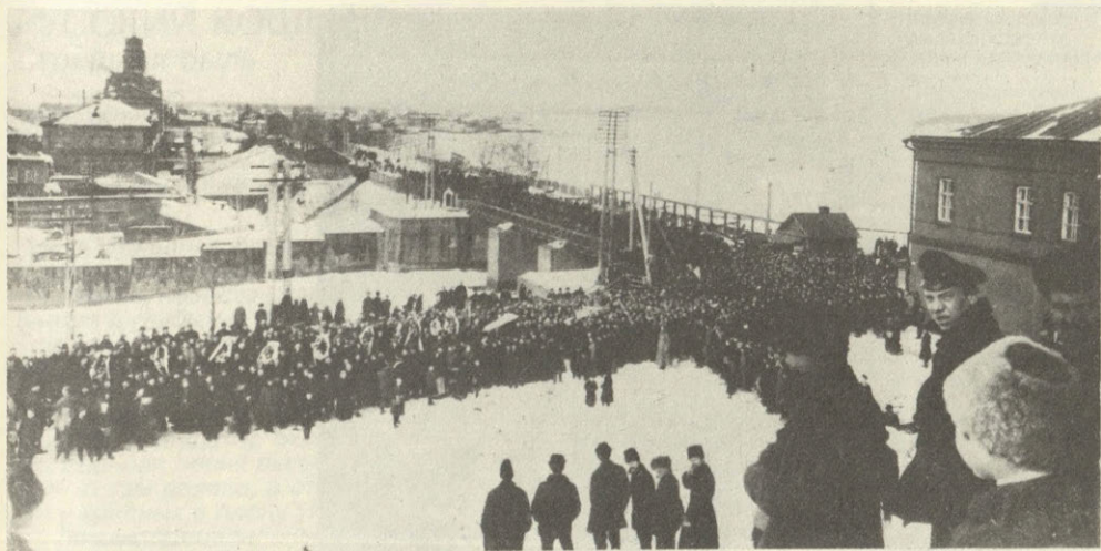
Ижевск. Март 1918 года. Похороны меньшевика Аполлона Сосулина, превратившиеся в антибольшевистскую демонстрацию. До восстания — один месяц.

Т.Стахов „Ижевская правда“, 17 декабря 1918 г.