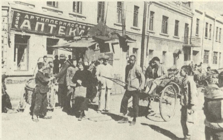
Китайский рикша везет русскую женщину. Харбин. 1945 г.

Газета „Время“, Харбин, 1943 г., 17 августа