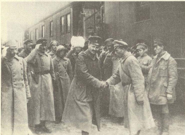
Л. Д. Троцкий среди командиров красноармейцев на Восточном фронте.

Пред. Рев. Воен. Совета Республики Л. Троцкий