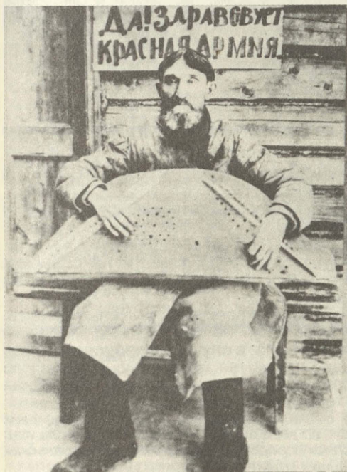
Гуслер-агитатор. „Красная“ агитация вотского населения

Колчаковский журнал „Единая Россия“, 1919 г., № 2.