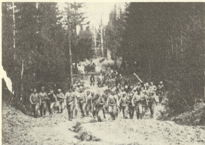
Продвижение колчаковцев по Сибирскому тракту.