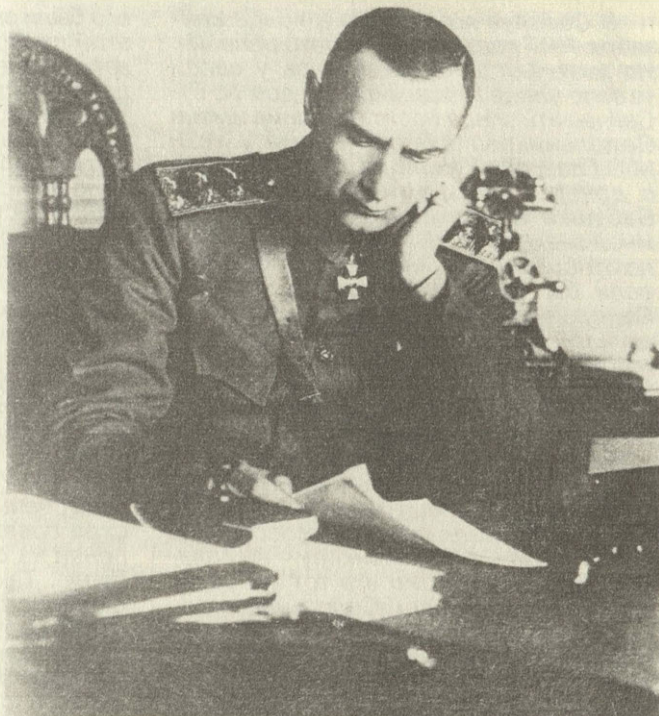
Адмирал Колчак. Март 1919 года.

Урал сейчас в наших руках: мы вернули Ижевский завод, Пермь с Мотовилихой, Екатеринбург, Златоуст, всю до низу Сибирь с неисчерпа- емыми продовольственными богатствами, мы стояли на одной ноге, теперь стоим на двух ногах: одна в Москве, другая в Екатеринбурге, те- перь нас свалить во сто раз труднее, чем полгода назад. „Ижевская правда”, 2 сентября 1919 г.