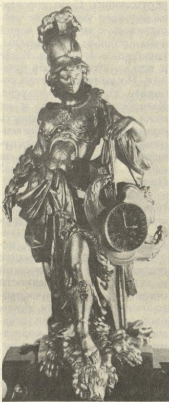
Каминные часы «Афина Паллада». Бронза, мрамор. XVIII в. Франция