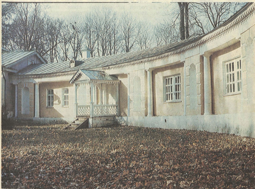
Спасское-Лутовиново. Флигель главного дома