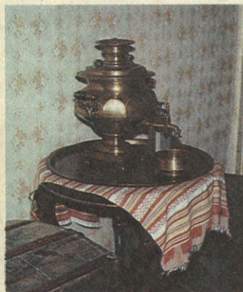
Самовар из дома в Спасском-Лутовинове