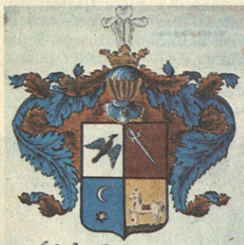
Герб рода Тургеневых