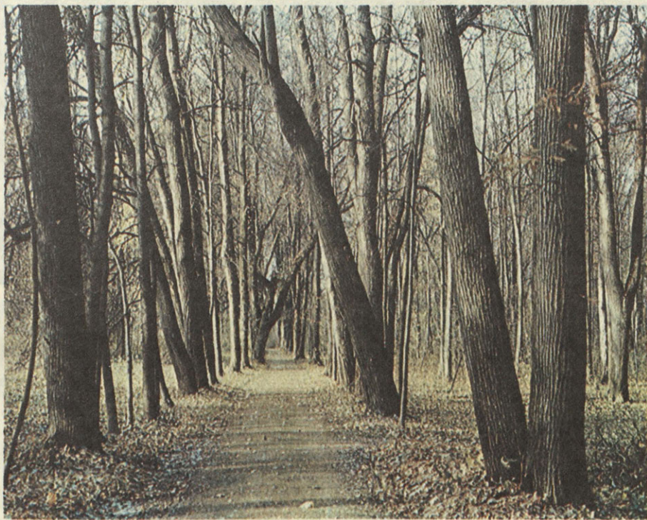
Аллея в парке Спасского-Лутовинова

Наследники лутовиновские, желая оставить Спасское за собою, выплатили за границу Виардо 90 тысяч золотом. Так что Иван Сергеевич на память о себе оставил только свои сочинения.