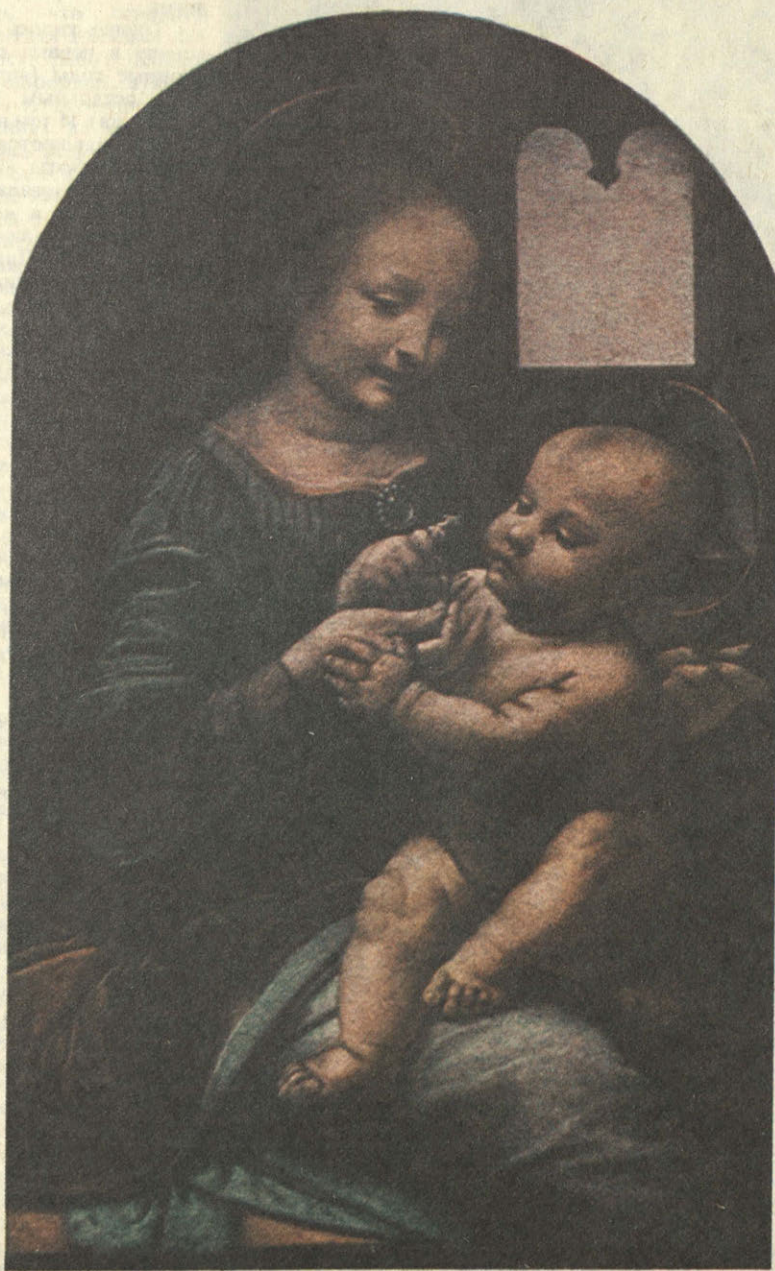
«Мадонна Бенуа» Леонардо да Винчи