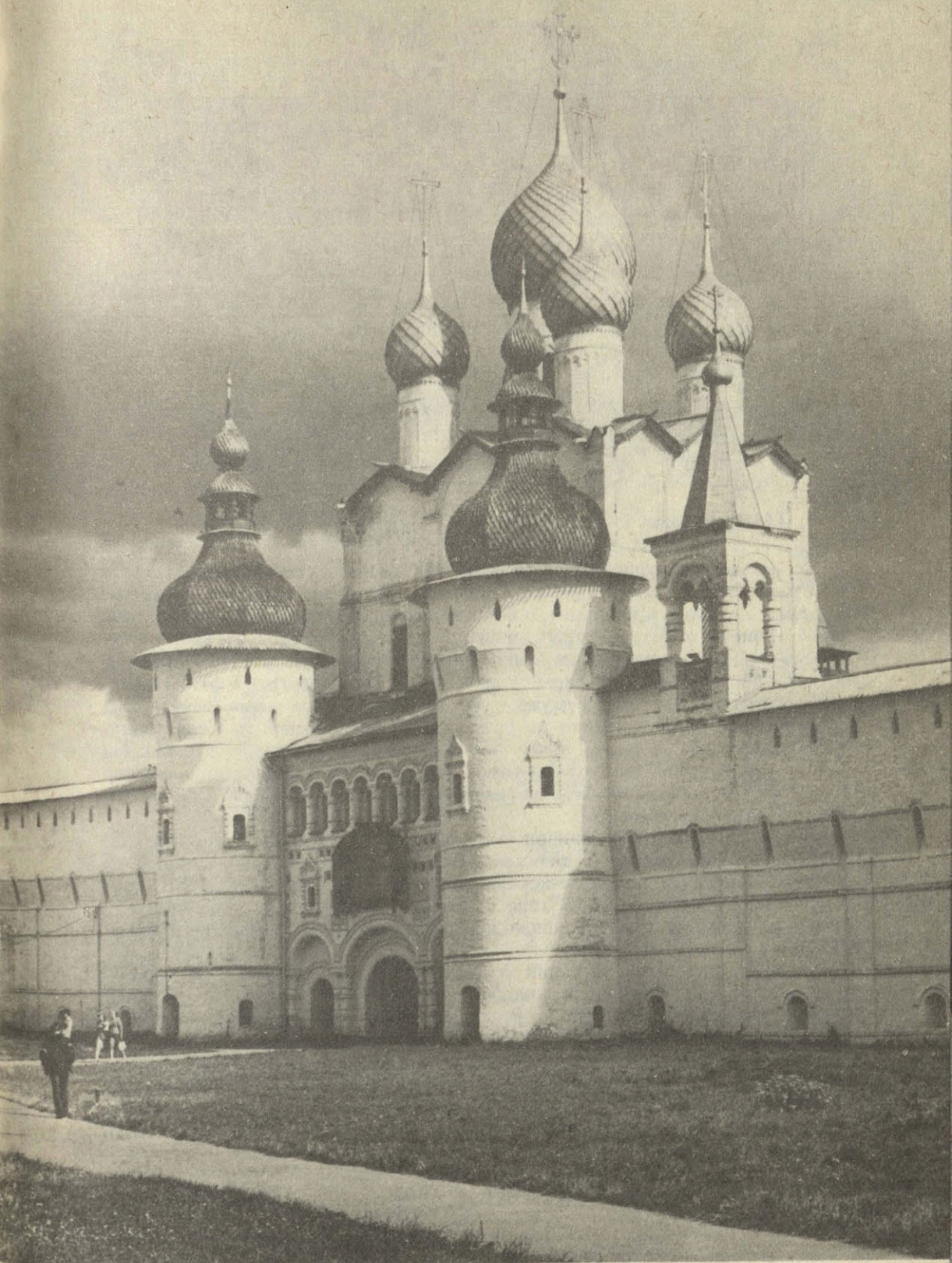
Ростов Великий. Фотоэтиюд А. Сулова