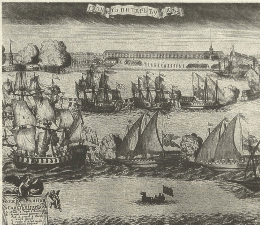
Торжества на Неве в честь победы под Гренгамом. С гравюры А. Зубова. 1720

«... Припал на самого султана и на весь народ великий страх: капитан Памбург пил целый день на корабле с моряками и подпил гораздо и стрелял с корабля в полночь изо всех пушек не однажды. И от той стрельбы учинился по всему Цареграду ропот и великая молва, будто он, капитан, тою ночной стрельбой давал знать твоему, государь, морскому каравану, который ходит по Черному морю, чтобы он входил в гирло...»