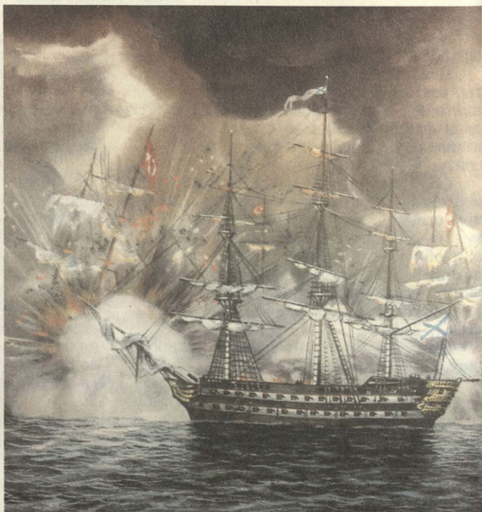
«Азов» — флагман русской эскадры в сражении при Наварине

вом и столь тяжком испытании, не изменили храбрости Русской. На «Азове», на ободрительные слова Адмирала: «Ребята! Вы не утратите достоинства флага Русского!», матрозы в один голос весело отвечали: «Рады умереть, Ваше Сиятельство!» Когда же «Азов» стал на якорь, и сам Адмирал скомандовал: «Пали!», то, казалось, не люди, а львы разъяренные и неутомимые вступили в бой. Они заряжали пушки с таким проворством, что дело офицеров состояло только в том, чтобы показывать им цель, — и не одного выстрела не пролетело мимо. В жару битвы палубы наших кораблей