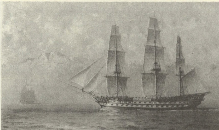
«Императрица Мария» — флагман Нахимова в Синопском бою. Из альбома рисунков Ганзена «Русский флот»

как фрегаты один за другим взлетали на воздух. Ужасно было видеть, как находившиеся на них люди бегали, метались на горевших палубах, не решаясь, вероятно, кинуться в воду. Некоторые, было видно, сидели неподвижно и ожидали смерти с покорностью фатализма. Мы замечали стаи морских птиц и голубей, выделяющихся на багровом фоне озаренных пожаром облаков. Весь рейд и наши корабли до того ярко были освещены пожаром, что наши матросы работали над починкой судов, не нуждаясь в фонарях. В то же время весь небосклон на восток от Синопа казался совсем черным...»