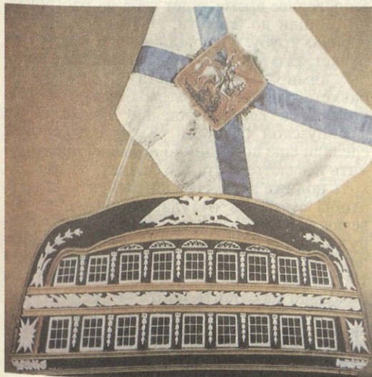
Кормовое убранство и Георгиевский флаг корабля «Азов»

⟨...⟩ Нахимов и Корнилов с вышки Морской библиотеки увидели в отдалении несметную массу судов. Сосчитать их изда-