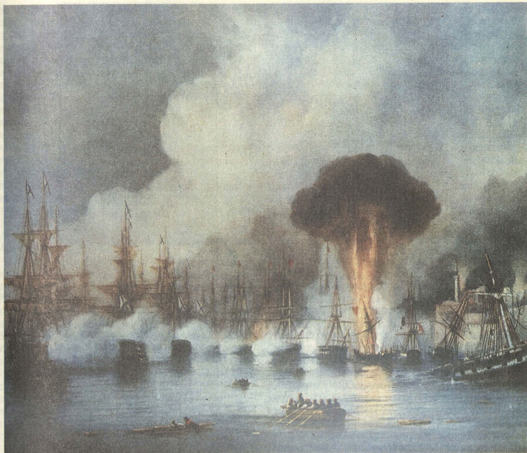
Синопское сражение. С картины А. Боголюбова. 1860

венным в этом отношении во всей эскадре Осман-паши), Слэд уже с самого начала битвы увидел, что турецкому флоту грозит поражение, а так как послом лордом Стрэтфордом ему было поручено наблюдать и доносить, а вовсе не класть свою голову в борьбе за Полумесяц, то, убедившись, уже вскоре после начала битвы, в неминуемой и сокрушающей победе Нахимова, он, искусно сманеврировав в самом опасном месте боя, вышел из рейда и помчался в Константинополь, забыв уведомить об этом своем внезапном бегстве своего прямого начальника Осман-пашу, которого покинул, таким образом, в самый трудный момент. За ним вдогонку полетели на всех парусах наши фрегаты «Кагул» и «Кулевчи», которые, как сказано, именно и были предназначены Нахимовым для наблюдения за «Таифом». Но им было не угнаться за быстрым пароходом, да еще превосходно управляемым.