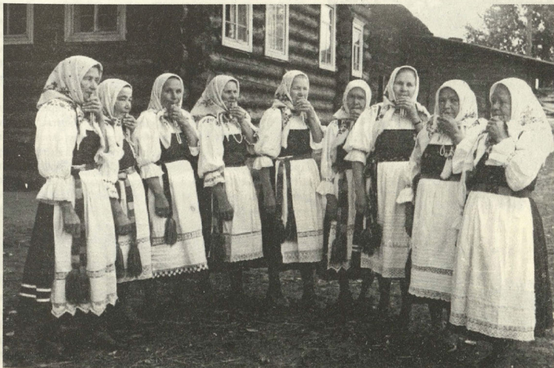
Чипсанистки из села Черныш.